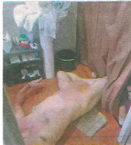
Investigan las causas del deceso de la pareja encontrada desnuda en casa de Tlalpan

Pero serán los dictámenes y la autopsia realizada por el médico forense, los que determinen las causas de la muerte.