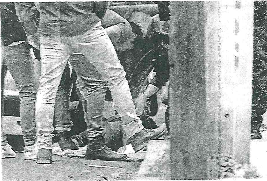
Una posible venganza habría sido consumada, allá en Leyes de Reforma /LUIS A. BARRERA