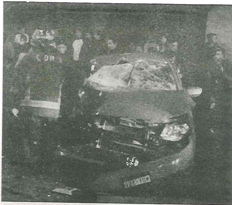
El auto quedó convertido en chatarra

a dos mujeres que quedaron prensadas dentro del vehículo, mientras que otra mujer y el conductor salieron por su propio pie.