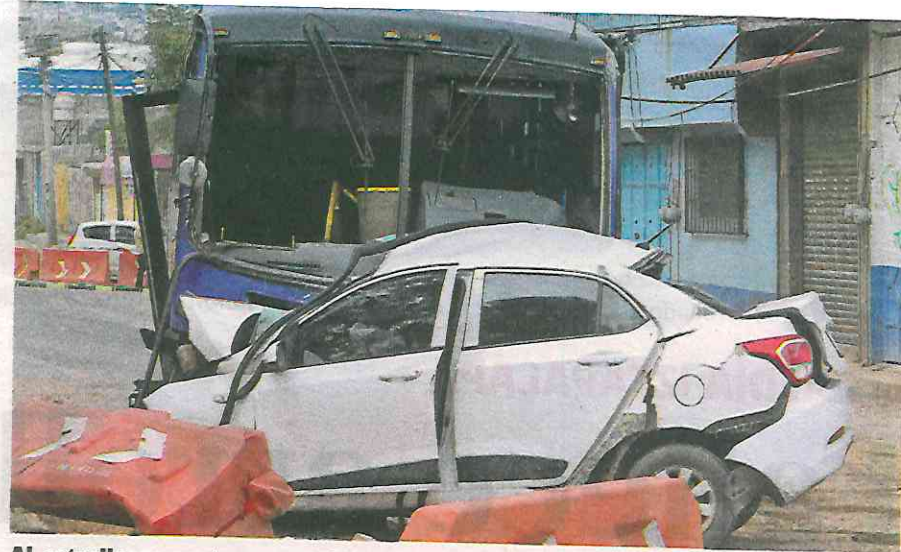
Al estrellarse contra un autobús, el conductor de un auto compacto murió prensado dentro de su vehículo