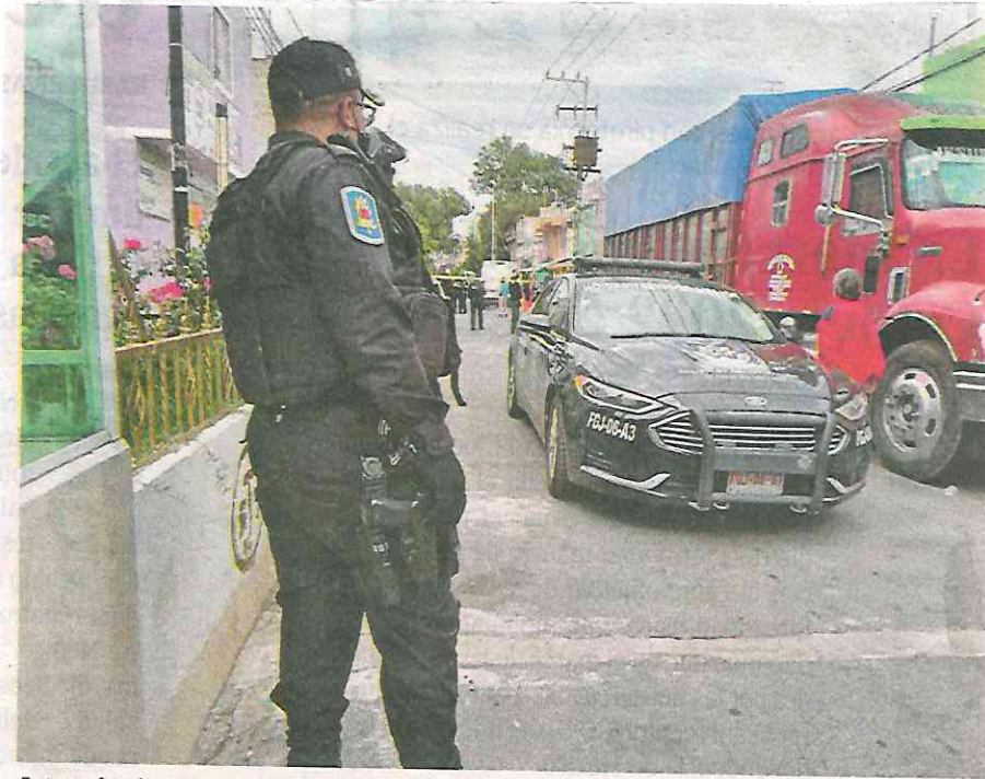
A través de un operativo se logró la captura de al menos un presunto homicida en una de las casas cercanas

“Es el hijo de Samantha el moreno” mencionó uno de los vecinos de la zona, quien solo observaba asombrado el esce-