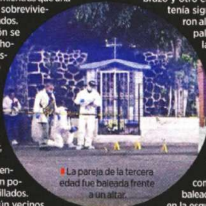
La pareja de la tercera edad fue baleada frente a un altar.

Paramédicos de Protección Civil verificaron que recibió cuatro tiros en el abdomen, pero lo mantuvieron con vida y lo trasladaron al Hospital Belisario Domínguez, a bordo de la ambulancia PC-09.