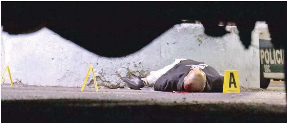
Asesinato a sangre fría en calles de la colonia Santiago Acahualtepec