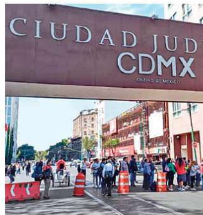
DEMANDA. Trabajadores del Tribunal Superior de Justicia capitalino exigen un aumento salarial del 7.7%

Mientras eso ocurría en la avenida Niños Héroes, Patriotismo y Juárez otro grupo de manifestantes cerraron los cruces de Arcos de Belén y el Eje Central Lázaro Cárdenas, en demanda de una vivienda, por lo que tuvo que intervenir una comitiva a la Secretaría de la Contraloría para que fuera liberada la vialidad. /24HORAS