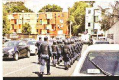
Un grupo de policías estuvo adentro de la zona acordonada.

27 años de edad tenía el hombre que abatieron los policías