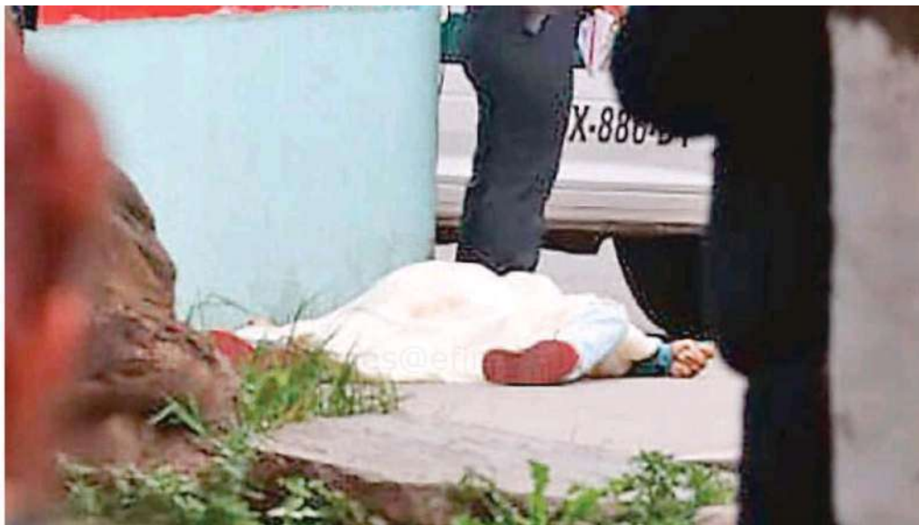
Los peritos arribaron al lugar de los hechos para recabar los indicios, mismos que integraron en la carpeta de investigación