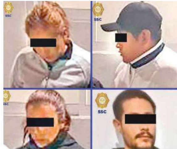
Detenidos en el Autódromo Hermanos Rodríguez

Además, como parte de los trabajos para prevenir la reventa de entradas, el día de la clausura, 22 personas fueron remitidas ante el Juez Cívico por vender boletos a un precio diferente al de taquillas; es importante mencionar que, durante los dos días del festival, un total de 54 personas fueron detenidas por el mismo hecho.