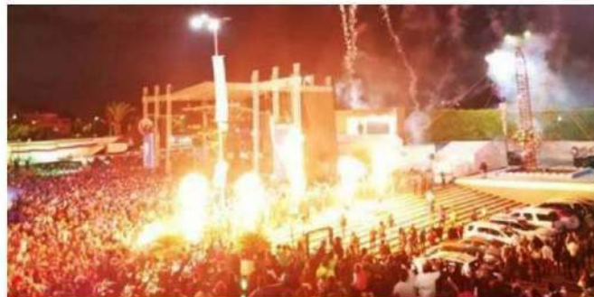
La alcaldesa afirma que en Venustiano Carranza han tenido las mejores fiestas patrias de la capital.

La edil señaló que los cientos de carrancenses y de vecinos de otras alcaldías que acudan a esta plaza pública también disfrutarán de una feria de juegos mecánicos, de puestos de antojitos mexicanos y de muchas diversiones más. Añadió que para tranquilidad de los asistentes, integrantes de la Policía Comando VC y trabajadores de Protección Civil, junto con equipo especializado y una ambulancia, recorrerán permanentemente la explanada para llevar con seguridad la noche más importante de todos los mexicanos. • (Redacción / Crónica)