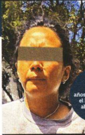
Una mujer fue detenida por la Policía.

Más tarde, los peritos de la Fiscalía retiraron del mismo sitio la pistola que presuntamente utilizó Jonathan y tres indicios balísticos metros atrás.