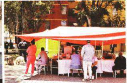
Un grupo de policías estuvo adentro de la zona acordonada.