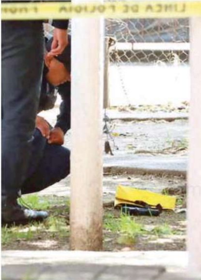
En el lugar quedó tirada el arma que portaba el delincuente