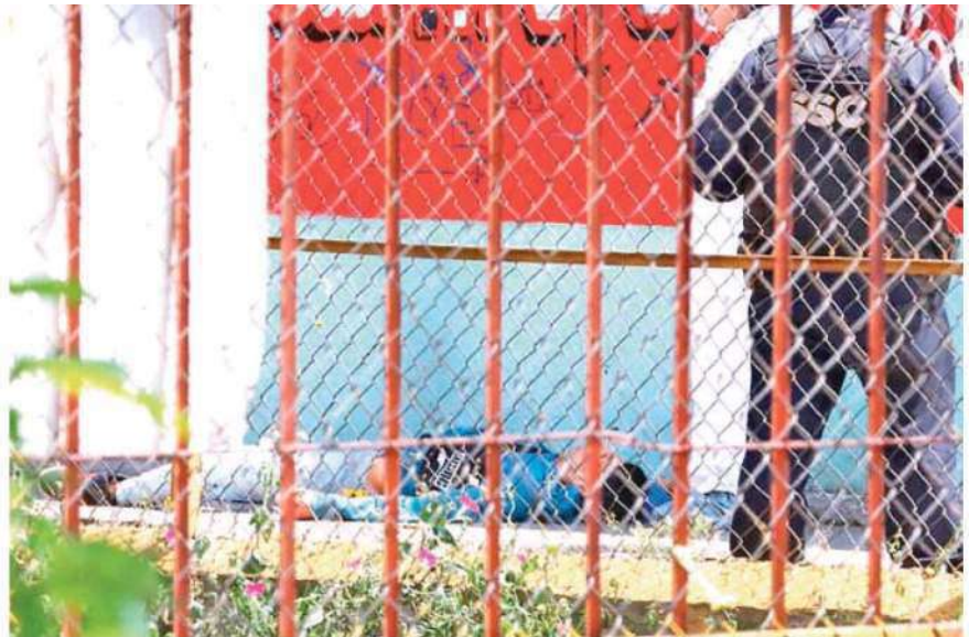
Autoridades policíacas continúan con las pesquisas