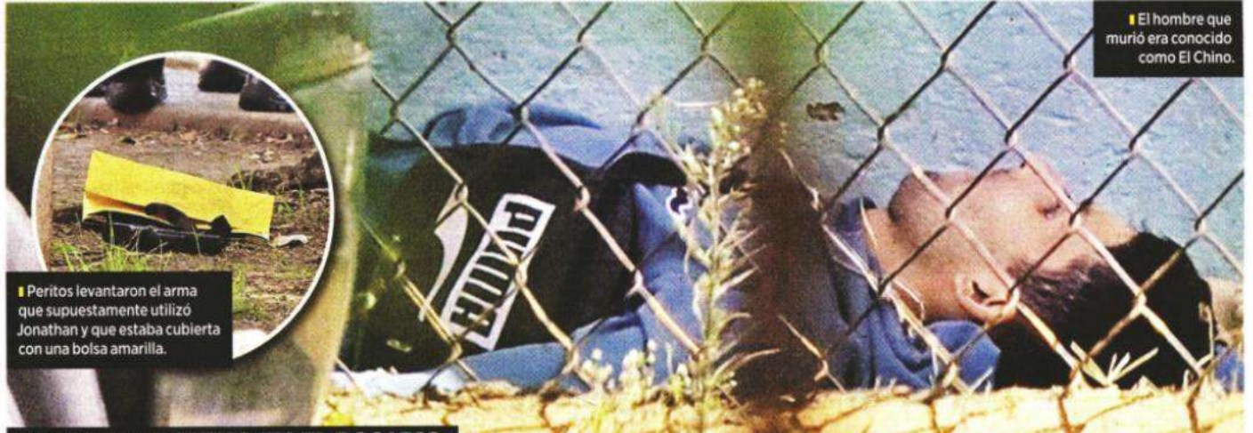
El hombre que murió era conocido como El Chino.