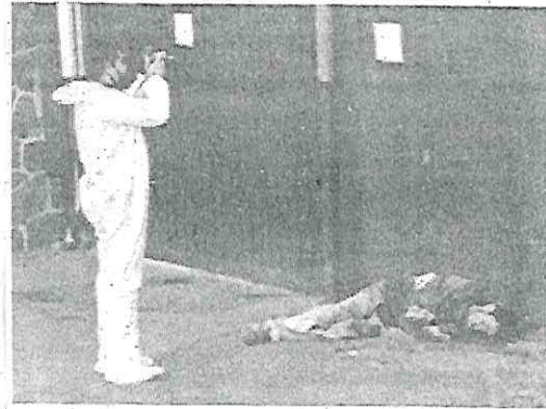
Lo atacaron con objeto punzocortante

Paramédicos arribaron al sitio para revisar a la persona lesionada, pero ya no contaba con signos vitales.