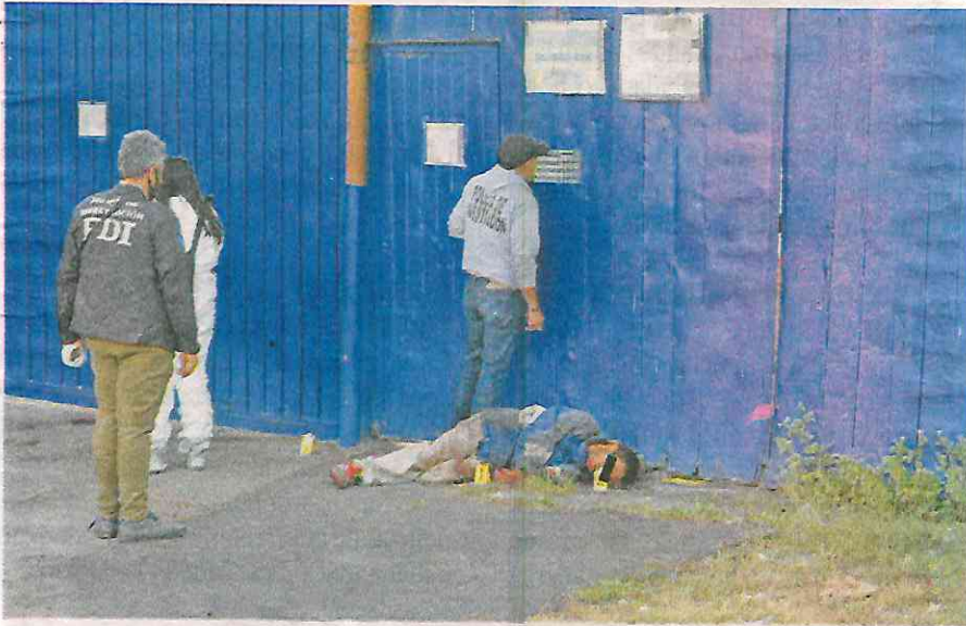
El cuerpo fue descubierto por una persona que caminaba por la zona