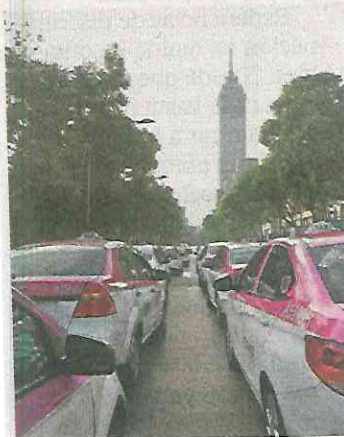
Los taxistas están en contra de las apps de transporte privado.

Dijo que no revelará el lugar de donde partirán las manifestaciones, porque no quieren que ocurran situaciones como las del pasado 19 de febrero, cuando fueron reprimidos por la policía en Insurgentes y el Eje 1 norte. ●