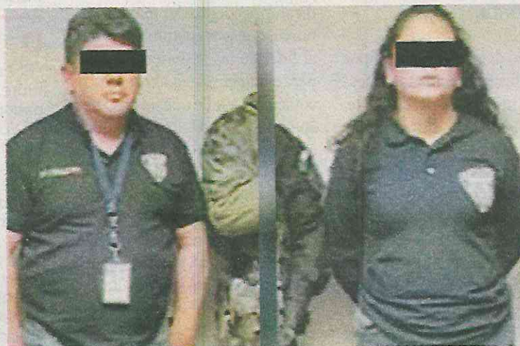
Se protegían como funcionarios... son malandros

Por redes sociales, los habitantes de Cuajimalpa, le res-