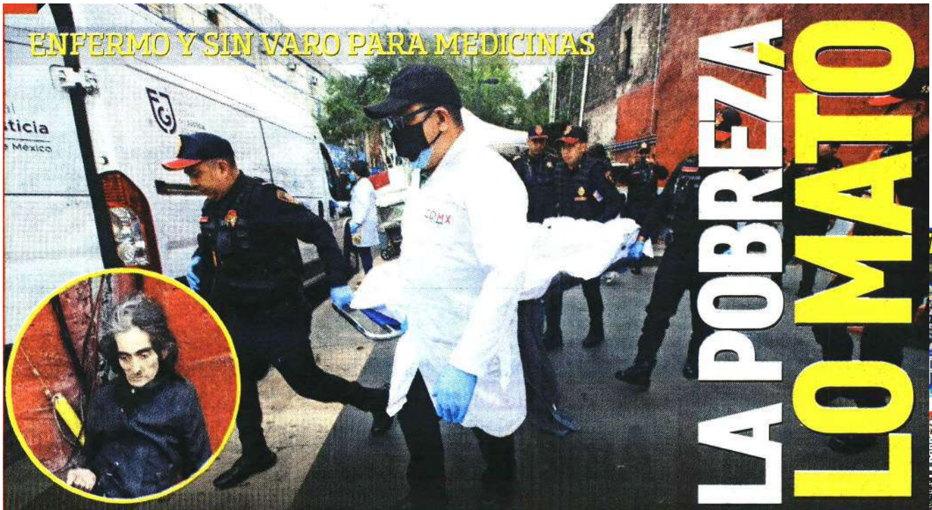
Un hombre que vivía en situación de calle fue hallado sin vida afuera del metro Hidalgo