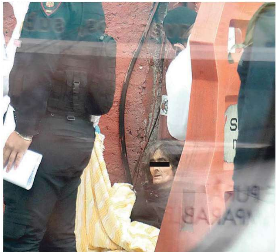
El sitio quedó a resguardo de los uniformados del sector Buenavista

veladora junto al cadáver del hombre que no fue identificado. Minutos más tarde personal de Investigación Forense y Servicios Periciales acudieron al punto y tras concluir las diligencias trasladaron el cuerpo del ancianito al anfiteatro correspondiente donde se espera que familiares acudan a reconocerlo.