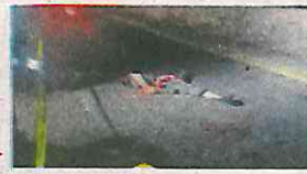
Dantesca escena dejó a su paso veloz vehículo

Al lugar llegaron elementos de la Secretaría de Seguridad Ciudadana (SSC), quienes se percataron de un sujeto tirado so-