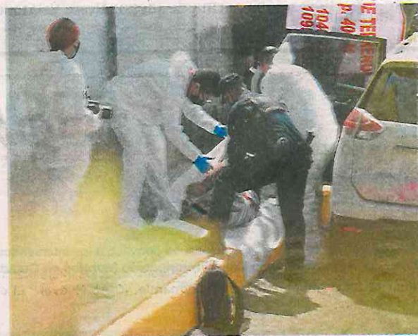
Un par de días atrás oyeron balazos, pero apenas descubrieron el crimen

“De nada sirve que ahorita estén tantos policías, si cuando los necesitamos no vienen y nos ignoran. Siempre denunciamos sobre los vecinos borrachos que echan