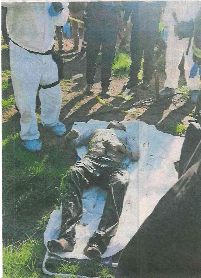
El hombre no presentaba ninguna lesión a simple vista.

Vecino de San Gregorio Atlapulco vio el cuerpo y llamó a las autoridades