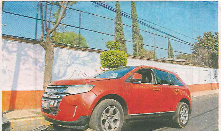
Parecía una fiesta, luego todo quedó en silencio, dijeron

“Estaban como en una fiesta, pasaron un rato ahí afuera y tenían música, después ya nos dimos cuenta que empezaron a llegar patrullas y ambulancias, pero después ya no dejaron pasar a nadie y ya nos comentaron que había un muerto”, sostuvo un habitante de la zona que se acercó a observar la camioneta.