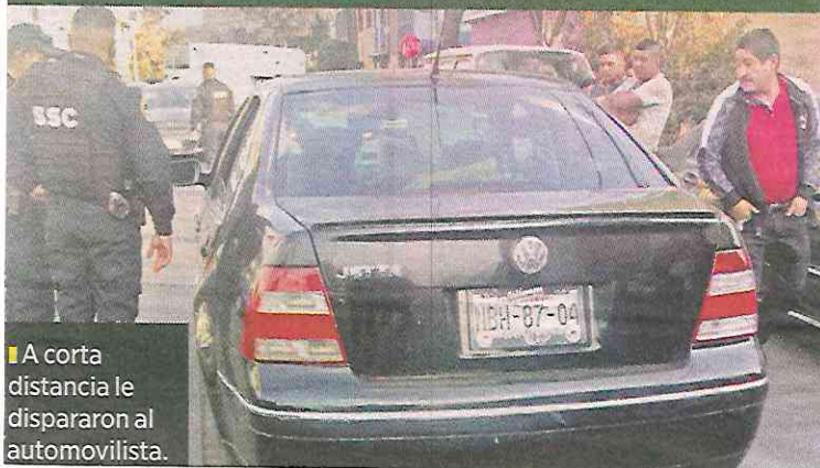
A corta distancia le dispararon al automovilista.

De inmediato contaron las evidencias balísticas del lugar, tomaron fotos del automóvil, y mientras tanto los parientes del fallecido lloraban.