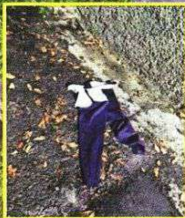
Al huir el agresor se quitó varias prendas.