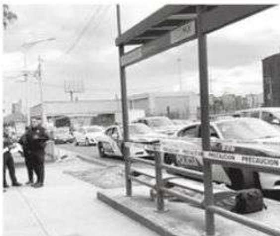
Otra tragedia citadina

· Al parecer el sujeto murió de un paro cardíaco