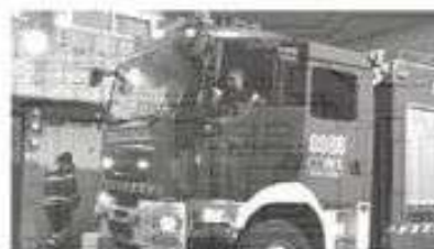
Vulcanos hallaron el cuerpo

Posiblemente, el incendio cobró vida debido a que dejó una veladora prendida