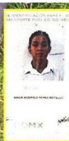
"El Sapo" fue microbusero.