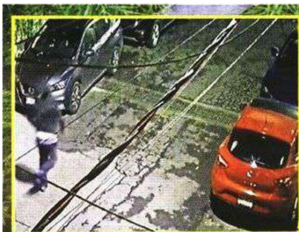
El atacante abandonó un automóvil y escapó corriendo.