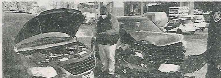
De milagro no sucedió una desgracia mayor

Los conductores circulaban a la altura de las calles mencionadas, pero uno de ellos no respetó la luz roja del semáforo y el encontronazo, lo que originó que terminaran estrellados en