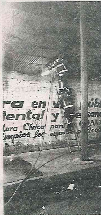
Bomberos apagaron el fuego

Los cuerpos de emergencia no reportaron lesionados, sólo daños materiales