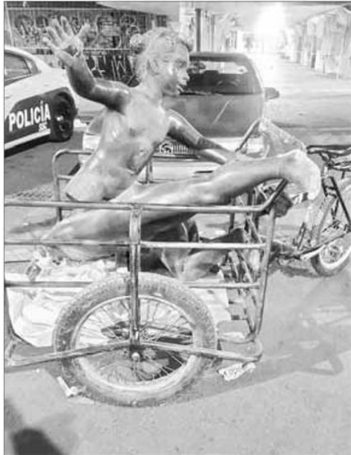
▲ El responsable iba muy campante con su botín, además del vehículo que también había hurtado.

No es la primera vez que son cortadas para vender el metal