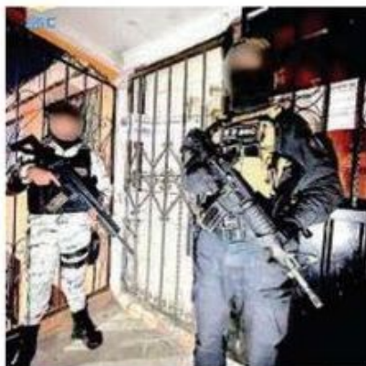
Policías capitalinos, con apoyo de GN, dieron el golpe al hampa

Además, de acuerdo con los primeros reportes, cinco de los detenidos, entre ellos la mujer, cuentan con antecedentes delictivos por delitos contra la salud y robo; y uno más registra una orden de aprehensión por delitos contra la salud.