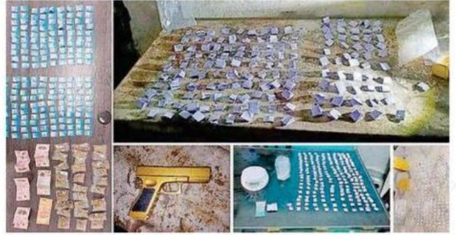
Más de 500 dosis de aparente droga fueron asegurados