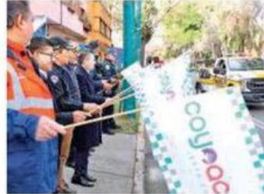
En marcha el primer dispositivo de Chatarrización 2024

El banderazo tuvo lugar en el Centro de Emergencias Coyoacán (CEC)