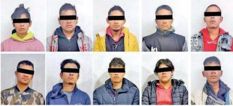
Diez presuntos narcomenudistas fueron detenidos durante los cateos en la alcaldía Iztapalapa