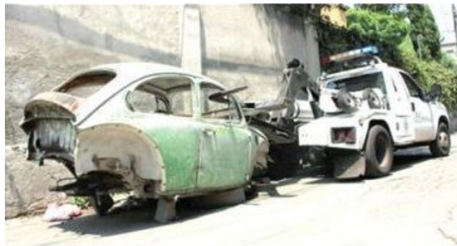
Se evitaría con esas acciones riesgos sanitarios

Además, buscarán mantener a la demarcación entre las más seguras