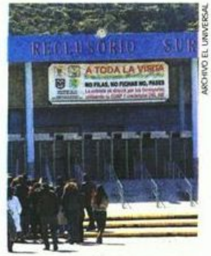
El agujero fue encontrado en un dormitorio de la zona cuatro del Reclusorio Sur.

ocupaban el dormitorio en donde se encontró el hoyo.