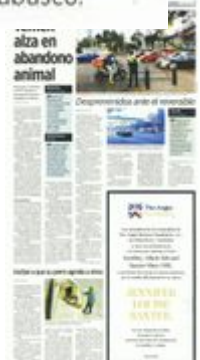
EL AJUSTE. Agentes de la SSC participaron en el programa del carril reversible en Eje 5 Sur, con dirección a Churubusco.