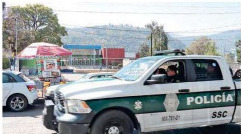
Ante el hallazgo se aplicaron los protocolos de seguridad correspondientes

No es la primera vez que aparece un hoyo en la pared de uno de los dormitorios