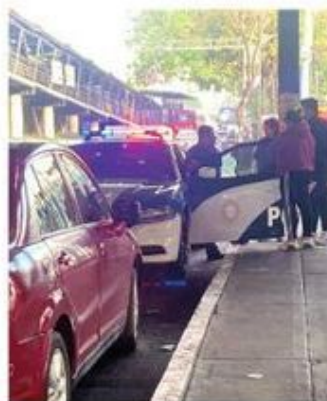
El bebé llegó bien