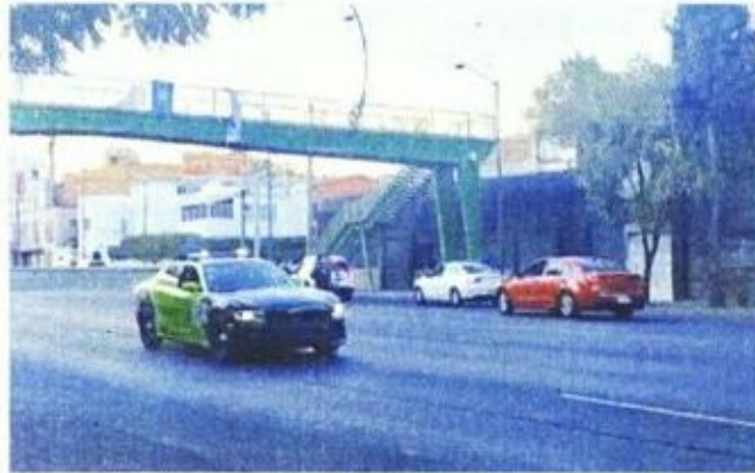
La medida busca mejorar la movilidad de aproximadamente 3 mil 750 vehículos que van de Poniente a Oriente cada hora.