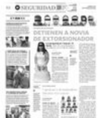
Les cae la voladora