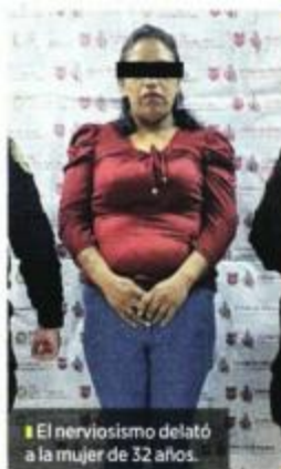
El nerviosismo delató a la mujer de 32 años.