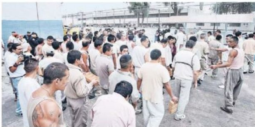
Los Ceresos reflejaron un incremento de 22 mil 969 internos, al pasar de 205 mil 954 reos al 30 de septiembre de 2024 a 228 mil 923 reclusos en noviembre de 2025.