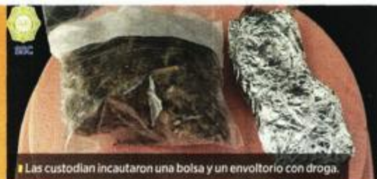
Las custodias incautaron una bolsa y un envoltorio con droga.

Por ello, le realizaron una minuciosa revisión de seguridad, tras la cual le hallaron entre su ropa interior y sus piernas, una bolsa de plástico y un envoltorio confeccionado