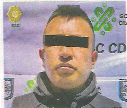
La actitud nerviosa lo delató al manipular una bolsa con posible droga

Cabe hacer mención que, luego de realizar un cruce de información, se supo que el hombre cuenta con cinco ingresos al Sistema Penitenciario de la Ciudad de México, por violencia familiar en 2012; por robo calificado agravado en pandilla en 2013; por robo agravado en 2019 y por delitos contra la salud en 2020 y 2021.