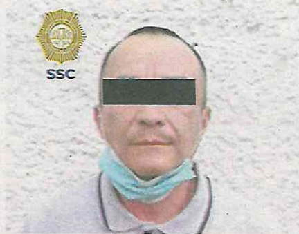
El hombre despojaría con violencia a su víctima del dinero que retiró; lograron detenerlo

Los oficiales se dirigieron al lugar de manera inmediata y se entrevistaron con un ciudadano de 52 años de edad, quien refirió que retiró dinero en efectivo de un cajero automático de una sucursal bancaria, cuando un sujeto lo amenazó con pa-