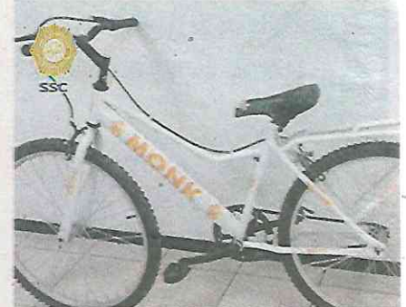
Abordó la bicicleta de su víctima e intentó escapar pedaleando de prisa

Los oficiales implementaron un dispositivo de búsqueda y localización del posible responsable, por lo que sobre el Circuito Interior a la altura de la Avenida Ca-