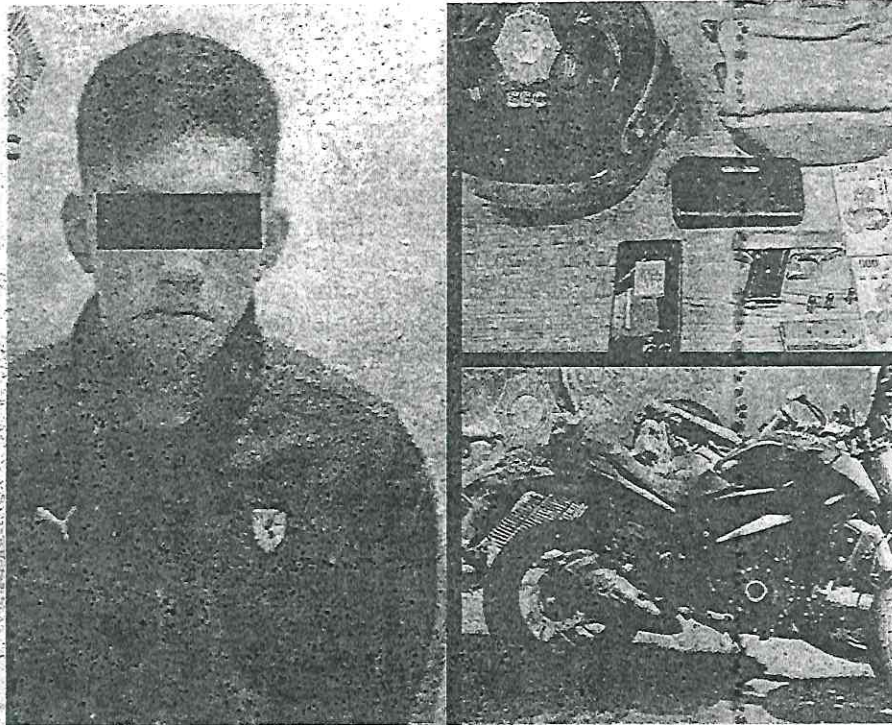
Estaría involucrado en otros asaltos, trabajaría con un cómplice, dijeron