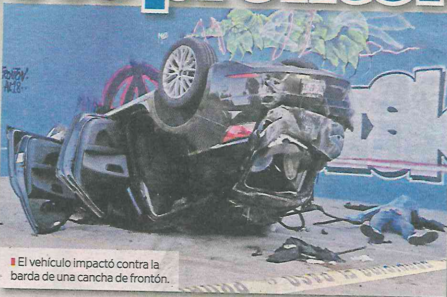
■ El vehículo impactó contra la barda de una cancha de frontón.

los tres hombres tripulantes salió proyectado del vehículo y murió.