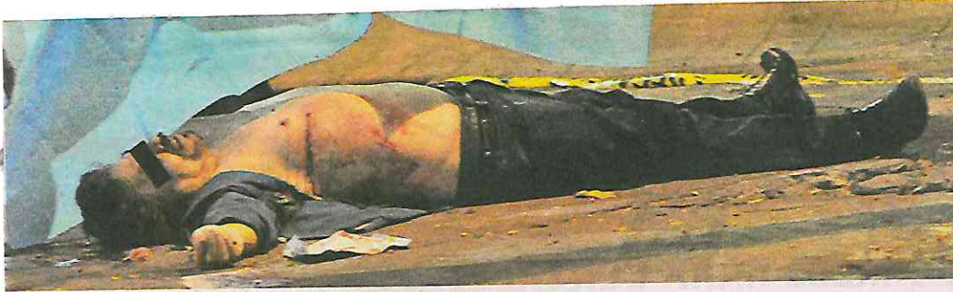
Enésima muerte por no des- prenderse de sus cosas en asalto