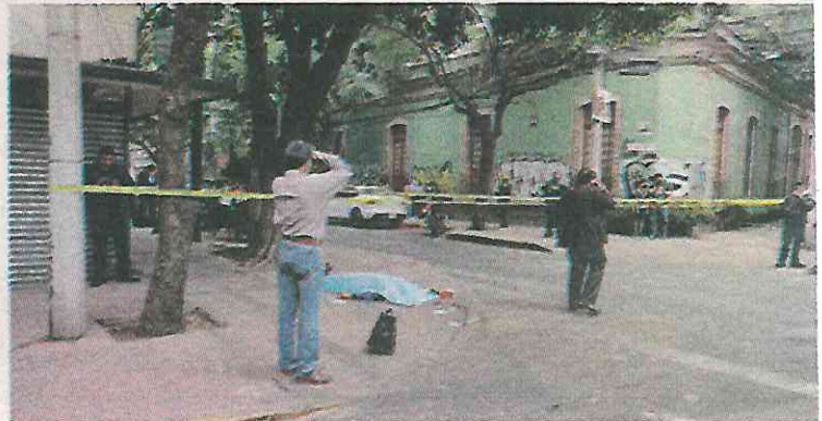
Otra víctima de la inseguridad en la capital

casquillos percutidos fueron localizados por peritos en la escena del crimen