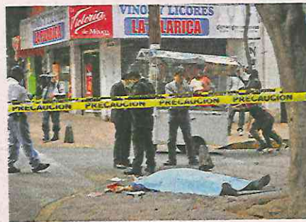
Otro es- cenario de víctima de asalto en la zona capitalina

Testigos de los hechos intentaron auxiliar a la víctima, al mismo tiempo que solicitaban apoyo a través del nú-