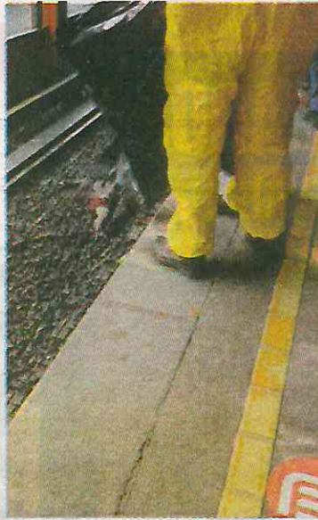
Penoso rescate de los restos

De acuerdo a versiones de testigos, la víctima, de aproximadamente 35 años de edad, estuvo caminando de manera nerviosa a lo largo del andén durante algunos segundos y en cuanto escuchó el silba-