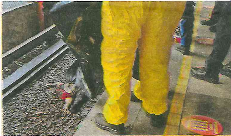
Los bomberos y el ERUM realizaron las maniobras necesarias para retirar los restos de la mujer