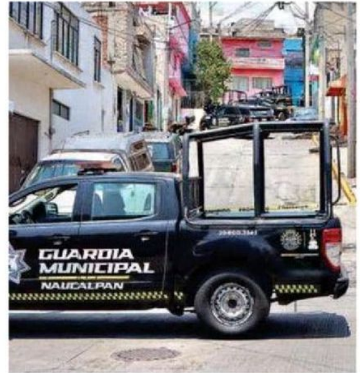
El hallazgo se registró en la calle Carlos A. Madrazo y Carlos Hank González