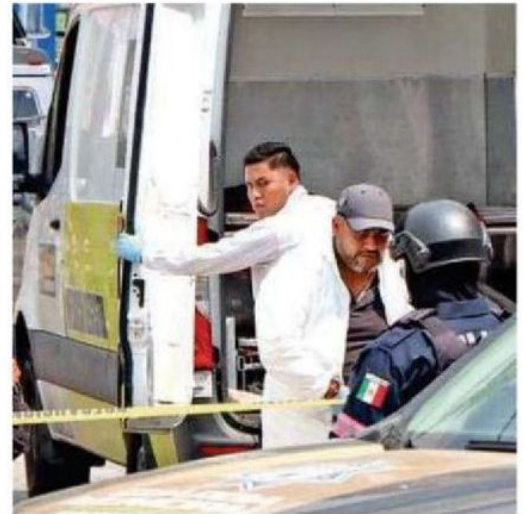
Pasadas las dos de la tarde llegó personal pericial

Elementos de PDI se entrevistaron con vecinos, donde un señor de la tercera edad solo dijo: "yo pensé que era basura y ahí lo dejé, yo no me iba a poner a revisar y me fui"