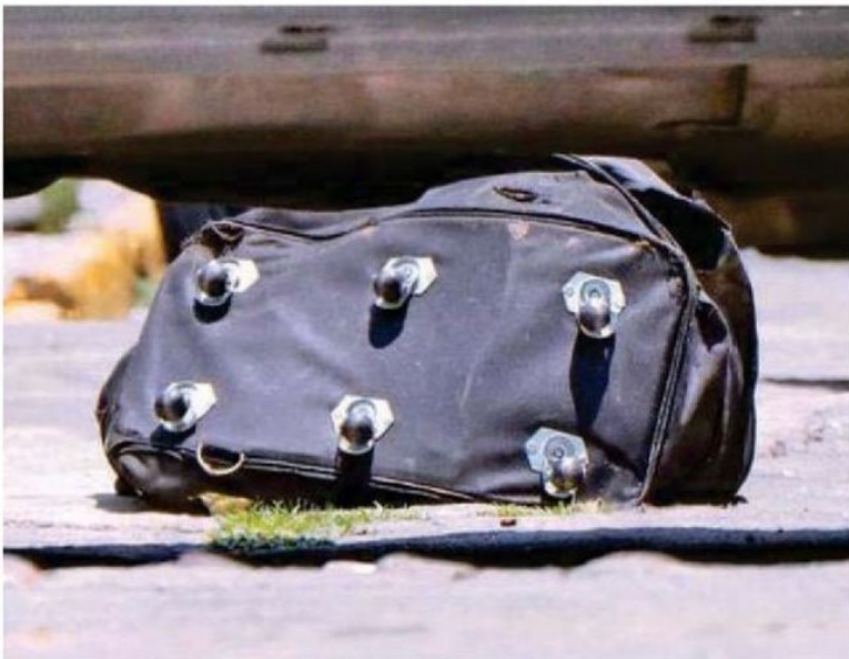
Al parecer , el torso de un hombre robusto estaba dentro de la maleta negra, de unos 50 centímetros de altura, con llantas en la parte de abajo