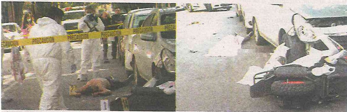
El golpe fue mortal por necesidad

La FGJCD-MX revisará las cámaras de videovigilancia de la zona para saber cómo ocurrieron los hechos y deslindar responsabilidades