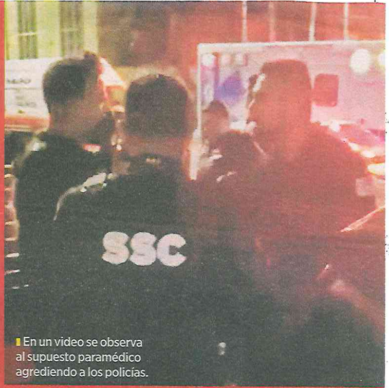
En un video se observa al supuesto paramédico agrediendo a los policías.