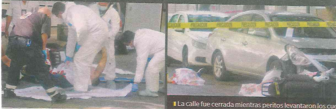
La calle fue cerrada mientras peritos levantaron los cuerpos.

Más tarde llegaron elementos de Servicios Periciales, quienes recogieron los indicios e hicieron el levantamiento de los cuerpos para llevarlos al Instituto de Ciencias Forenses con el objetivo de practicarles la necropsia de rigor.