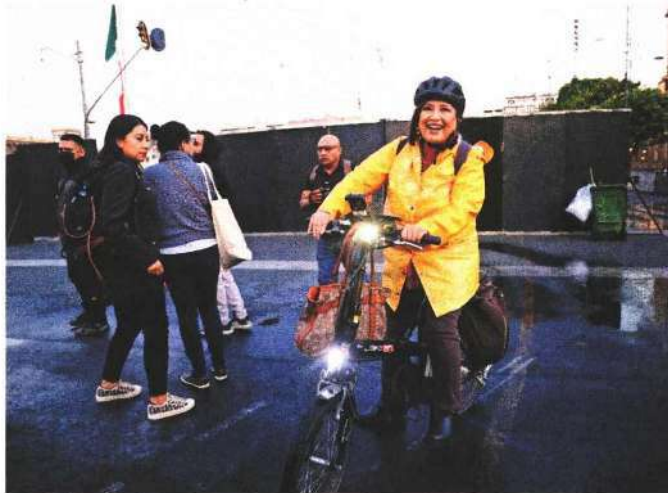
A bordo de su bicicleta y con amparo en mano, la senadora panista Xóchitl Gálvez llegó a Palacio Nacional a las 5:48 horas a la mañana.