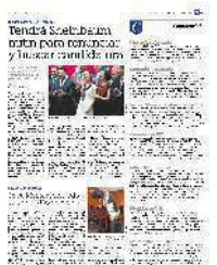
Despedida. Claudia Sheinbaum, jefa de Gobierno de la CDMX, ayer.