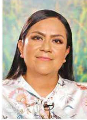
Ariadna Montiel, secretaria de Bienestar.