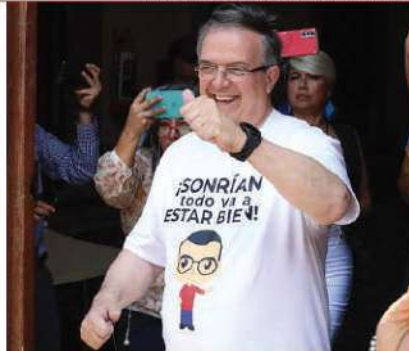
EBRARD, ayer, al salir de Palacio Nacional.