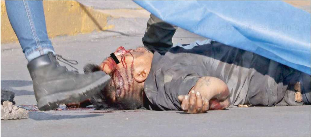
El cuerpo del sujeto golpeó en repetidas ocasiones el piso hasta quedar inmóvil e inconsciente