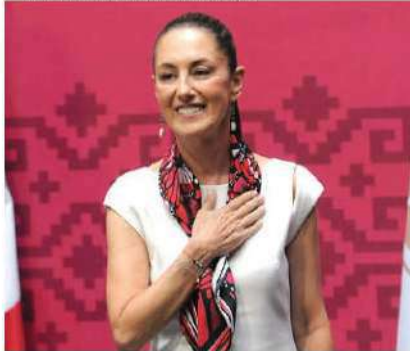
SHEINBAUM, tras anunciar que dejará el cargo.

MARTES 13 DE JUNIO DE 2023 • NUEVA ÉPOCA • AÑO 15 • NÚMERO 4361