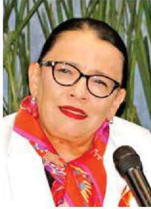
Rosa Icela Rodríguez, secretaria de Seguridad.