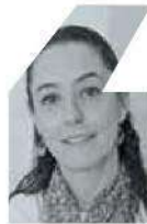
CLAUDIA SHEINBAUM JEFA DE GOBIERNO

"Muchas gracias, gracias de verdad, de corazón a todo mi equipo, que como siempre está al pie del cañón con convicción, compromiso y lealtad a un proyecto. Gracias y, sobre todo, al pueblo de la Ciudad de México por permitirme servirle. Gracias a este pueblo solidario y recíproco como pocos", concluyó.