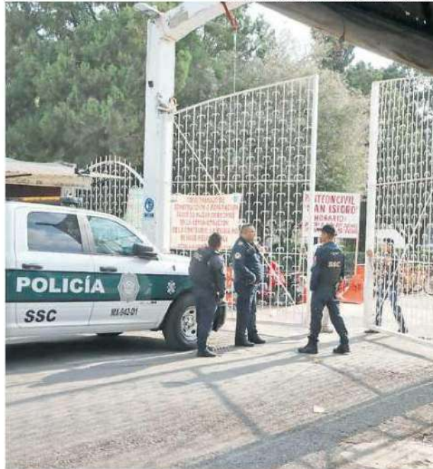
El 2 de mayo ocurrió el ataque en Azcapotzalco