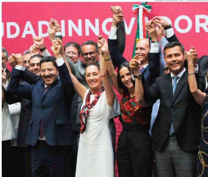
Claudia Sheinbaum se despidió ayer de su gabinete de la Ciudad de México.