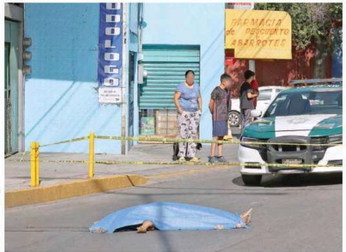
El chófer de la unidad fue detenido y puesto a disposición del Ministerio Público donde rendirá su declaración para destindar responsabilidades