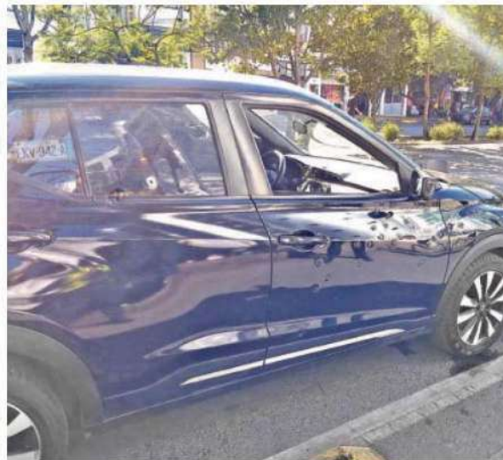
El hombre falleció a consecuencia de las heridas de bala