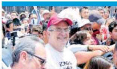
La camiseta de Marcelo Ebrard tenía la leyenda: "Sonrían, todo va a estar bien".