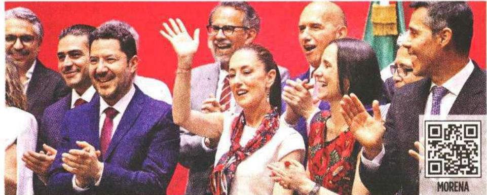
■ Claudia Sheinbaum informó que dejará la Jefatura de Gobierno el viernes 16.

Anticipó que, antes de irse, el jueves 15 presentará una rendición de cuentas en el Monumento a la Revolución, en un acto masivo, con recursos públicos, aprovechando todavía su condición de gobernante.