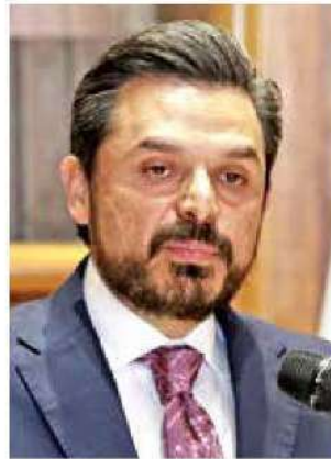
Zoé Robledo, director del Seguro Social.