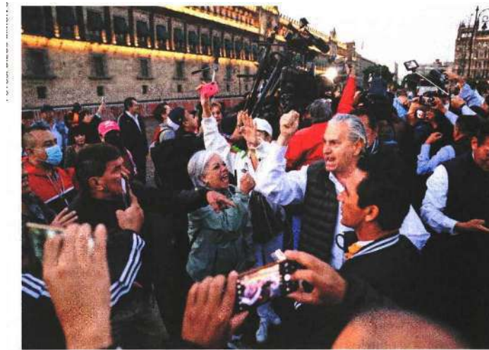
La legisladora caminó hasta la puerta de Palacio Nacional en medio de gritos de simpatizantes y opositores que se enfrentaron a gritos.