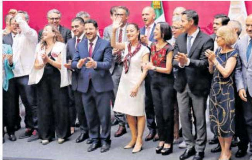
Al anunciar su salida, da las gracias al pueblo de la Ciudad de México.