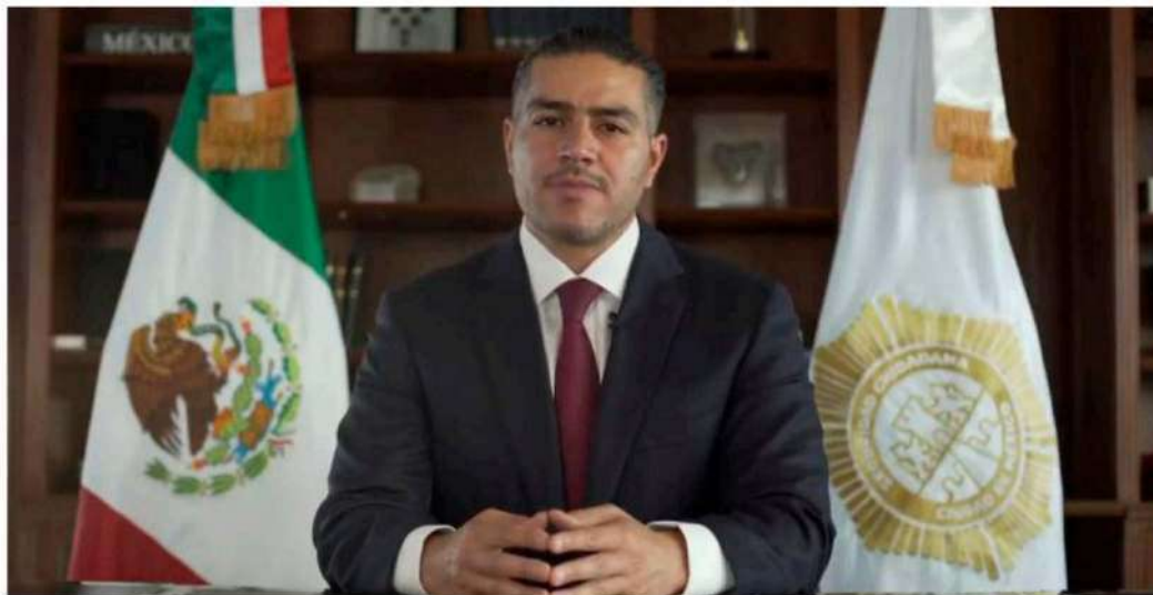
Omar García Harfuch, secretario de Seguridad Ciudadana, informó que también se detuvo a un mando policiaco y a un jefe de sector.