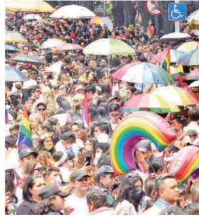
Morena detalló diez ejes denominados de reflexión para la acción

Asimismo, el congresista morenista se refirió a la vinculación perdida y la urgencia de recuperar la comunicación con las autoridades de la Secretaría de Seguridad Ciudadana (SSC), así como de la alcaldía Cuauhtémoc, como partida para transitar hacia una convivencia plural y una vida libre de violencia.