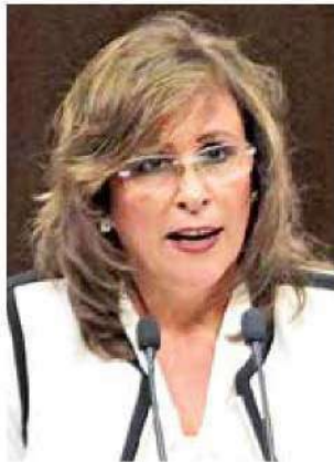
Rocío Nahle, secretaria de Energía.