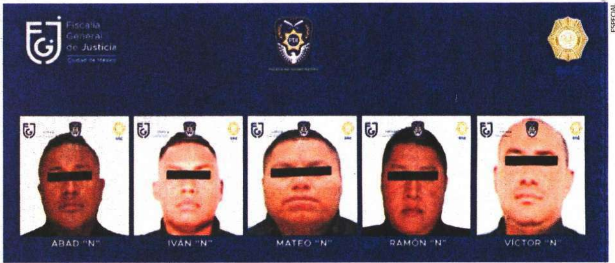
Los cinco policías permanecerán en el Reclusorio Preventivo Varonil Norte, informó el vocero de la FGJ, Ulises Lara.