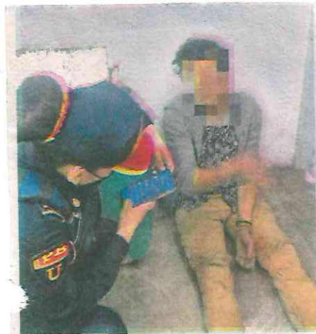
El hombre , de 30 años de edad aproximadamente, fue remitido al Juzgado Cívico

El incidente ocasionó un corte de corriente de 9 minutos, informaron las autoridades del Sistema de Transporte Colectivo Metro.