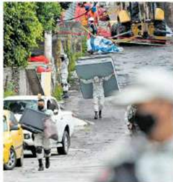
La Guardia Nacional apoya a los vecinos para desalojar sus casas