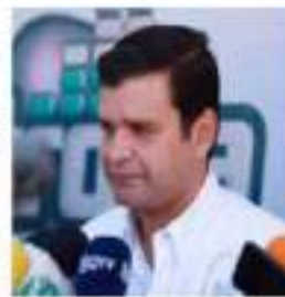
Antonio Echevarría, gobernador de Nayarit (PAN).

Coqueteos. El presidente Andrés Manuel López Obrador anunció ayer que invitó a Antonio Echevarría, gobernador de Nayarit (PAN), a que se sume a su gobierno. "Estoy pensando, sólo que me den tiempo porque luego me empiezan a presionar, y con razón, porque es su trabajo (de los periodistas), en dónde voy a invitar a Toño, a que nos siga apoyando en el gobierno federal", declaró en Tepic. PAGE