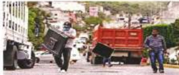
Trabajadores sacan aparatos eléctricos, documentos y tipo de sus cosas, ante el riesgo

Hasta el domingo 12 de septiembre, la zona de alto riesgo ya habían sido eva-