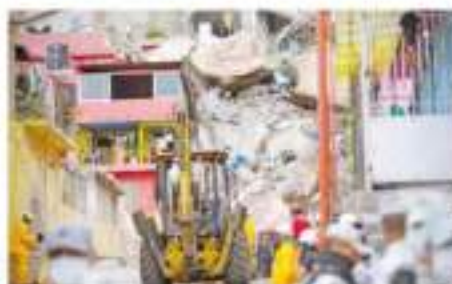
CERRO DE CHIQUIHUITE