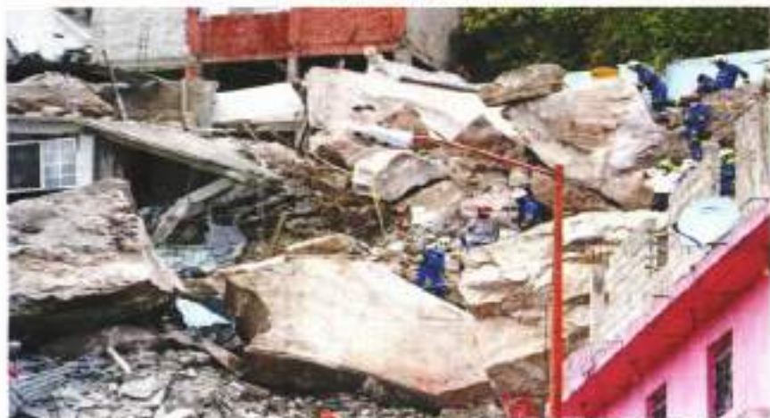
Los trabajos de rescate han sido complicados por la inestabilidad del terreno, los derrumbes y las condiciones climáticas.