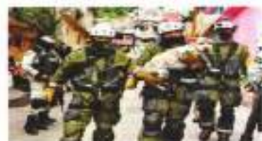
Rescate de la familia involucrada a tres metros que cayó casi tres días bajo piedras y tierra.