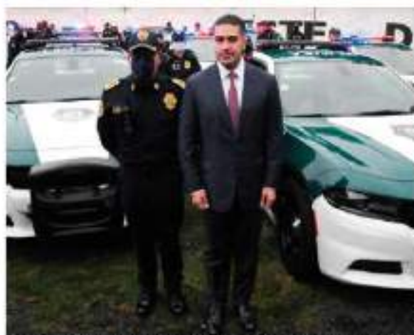
CON LA ENTREGA de 191 patrullas que refuerza la seguridad en Miguel Hidalgo, Álvaro Obregón, Gustavo A. Madero y Cuauhtémoc, se inició el plan de cuadrantes prioritarios.

Explicó que el objetivo del programa es reforzar la seguridad en 126 de los 847 cuadrantes en los que está dividida la Ciudad de México y en los que se concentra el 40 por ciento de la incidencia delictiva, por lo que se realizarán actividades de patrullaje y de cercanía con la población, atendiendo los problemas del entorno socio urbano,