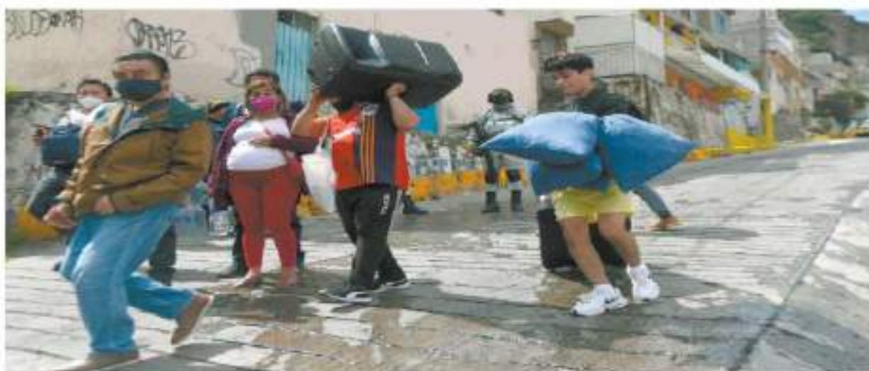
Familias recogen lo más que pueden de sus pertenencias ante el desalojo de sus viviendas en la colonia Lázaro Cárdenas, en Tlalapantla.