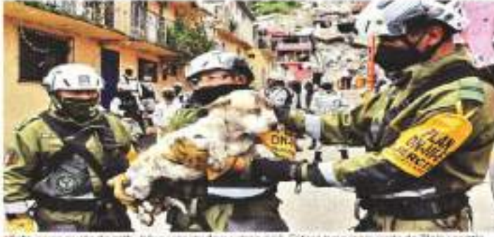
El día jueves se dio un primer momento de desalojo y evacuación. El día jueves se dio un momento de desalojo y evacuación.

"La posibilidad de una deserción es alta y por eso número el llamado a que la gente vaya de sus zonas ya así que es muy difícil dejar el número que han estado diciendo que una generación o incluso varias, pero es más complicado tener un ser que ir y estar bajo el sol", dijo. La evacuación que no ha sido preventiva, lo que