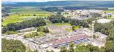
Después de su planta potabilizadora, el sistema Cutzamala sólo tiene una línea de conducción de agua hacia la metrópoli.

El Cutzamala se compone de siete presas con canales hacia la potabilizadora y un