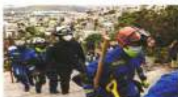
Obreros de rescate trabajan en la "zona cero", en la colada Lázaro Cárdenas Segunda Sección.