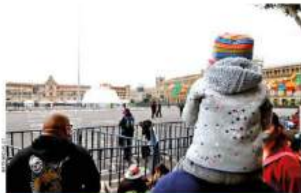
CEBADO. Ayer, decenas de personas en el cuadrante con las gaitas de ser el espectáculo de la marqueta del Templo Mayor.

En el resto de alcaldías aún no se realiza un aviso sobre los festejos patrios.