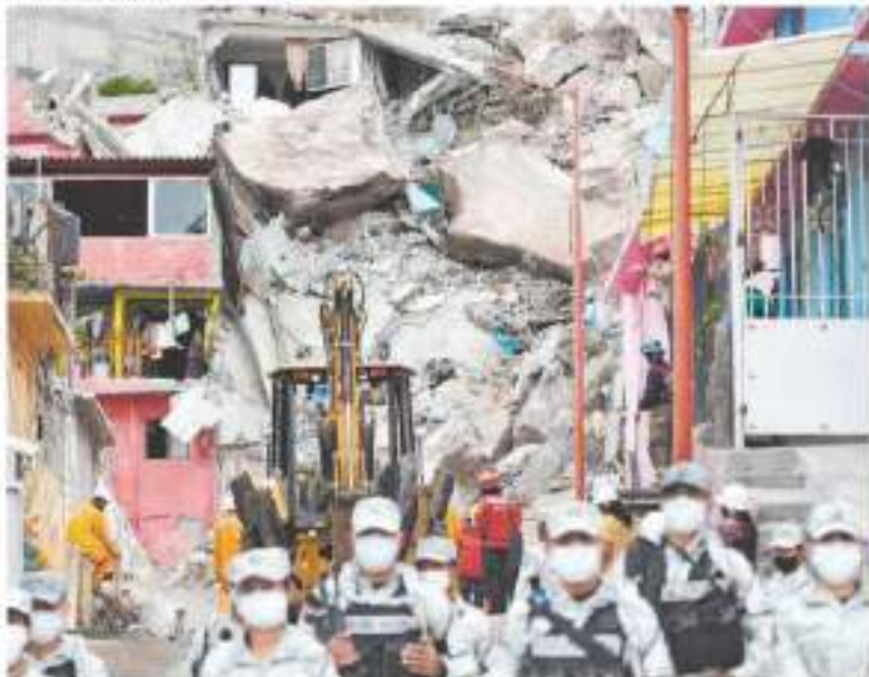
Las labores de rescate de los dos menores y su madre continúan