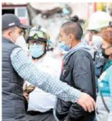
Jorge desea encontrar con vida a su familia

EL EDR, de Tlalnepantla informó que el riesgo de que existan más derrumbes en la zona es muy alto.