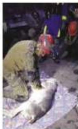
Un elemento de la Marina intenta salvar a un perro rescatado de entre los escorbijos del cerro del Chiquihuite.