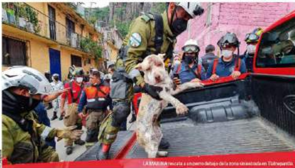
LA MARINA rescata a un perro debajo de la zona sin extraña en Tlalapantla.

Cuerpos de rescate apuntan a focas con pólvora y sacos de arena, marcan como zona de seguridad 126 viviendas y piden evacuar a las sólo en la mitad; acortan órdenes tras resaca en Tule y Tlalapantla, ven problema de viabilidad de más obras ante fenómenos naturales págs. 4 a 6