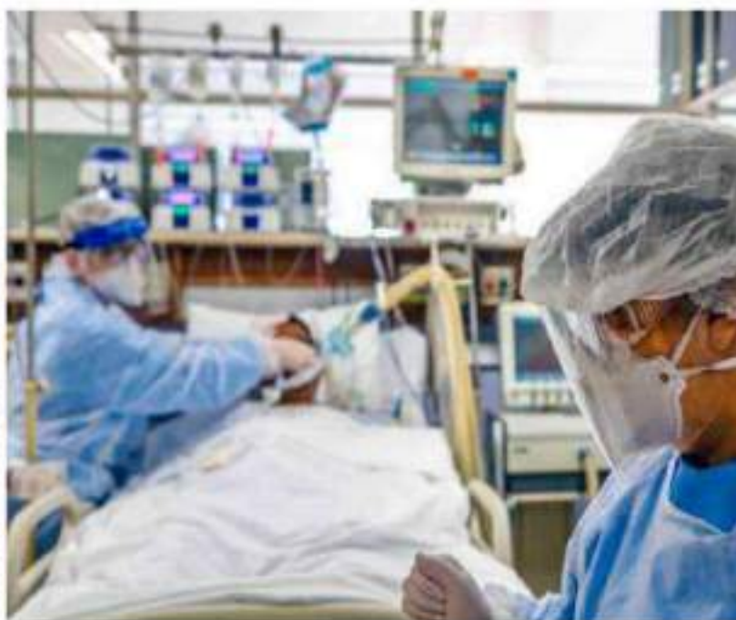
En la CDMX hay 2 mil 152 pacientes COVID-19 hospitalizados, de los cuales 686 permanecen intubados.

La Secretaría de Salud de la CDMX, señaló el día de ayer que la capital registró 2 mil 152 pacientes COVID-19 hospitalizados, de los cuales 686 permanecían intubados.