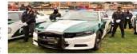
Patrullas que ayer comenzaron a patrullar en el sur de la Ciudad.

Rivera mencionó a los aspirantes en las guías publicadas en Internet por Semovt en donde se repiten los temas del examen teórico y se muestran videos sobre los ejercicios de pericia.