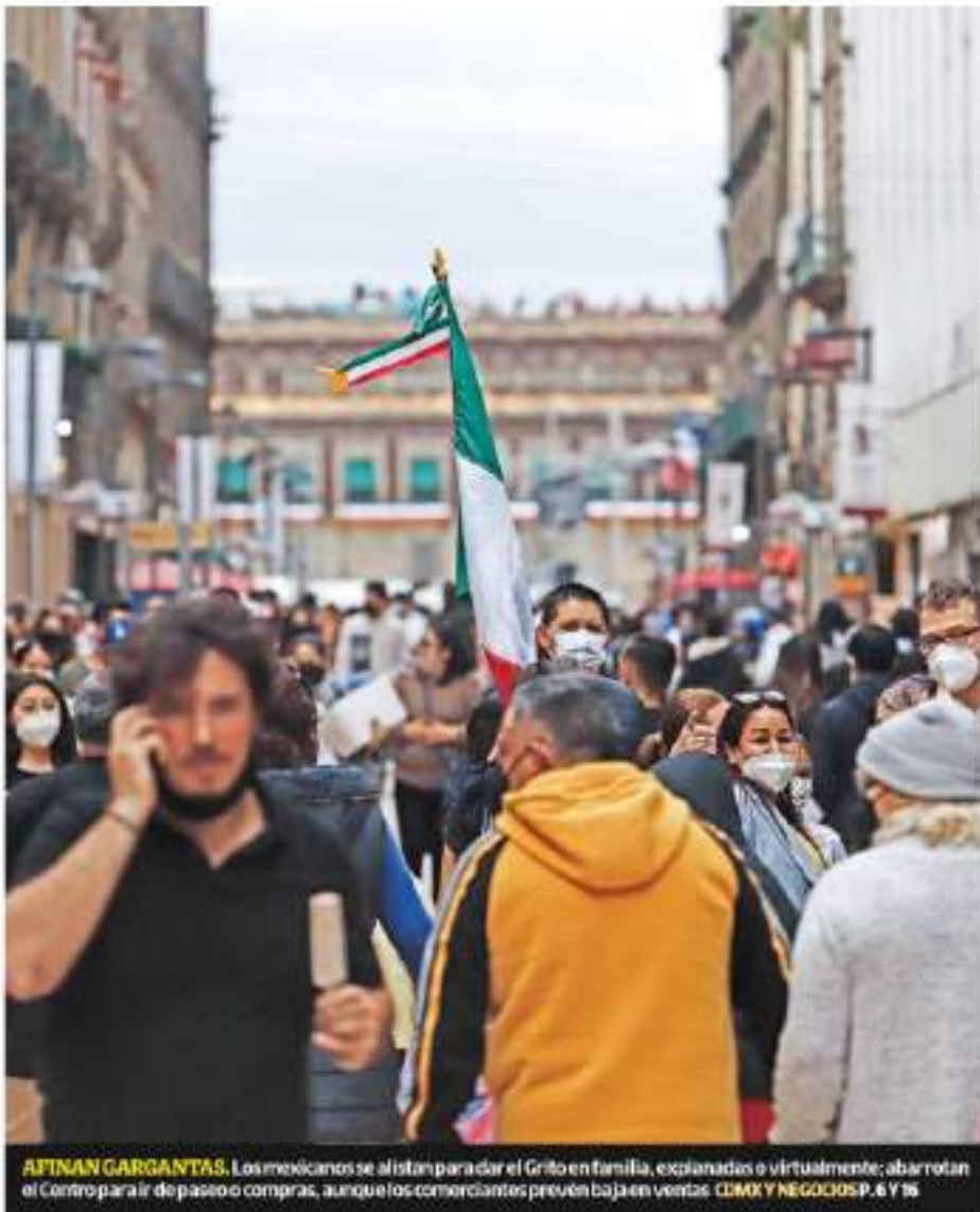
AJTNAN GARGANTAS. Los mexicanos se alistan para dar el Grito en familia, explanadas o virtualmente; abarrotan el Centro para ir de paseo o compras, aunque los comerciantes prevén baja en ventas. CDMX Y NEGOCIOS P. 6 Y 15

El Gobierno federal entregó a seis estados gobernados por Morena 295 millones de pesos del programa Tandas del Bienestar; Veracruz fue el más favorecido. En total, se dispersaron 902.1 millones de pesos, de los cuales 607 millones se distribuyeron entre las 26 entidades restantes, incluida la Ciudad de México, Oaxaca y Guerrero. El reparto benefició a seis administraciones morenistas casi 2 a 1 en promedio MÉXICO P. 3