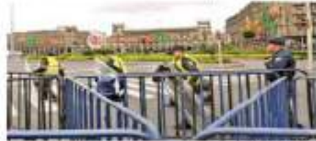
El Zócalo fue cerrado desde el sábado con el máximo operativo para evitar aglomeraciones al 15 de septiembre.

"El operativo tiene que ver con otros días de las fiestas patrias, entonces terminando el operativo se modificaron o se quitó eso, ya lo venimos con el propio gobierno de la ciudad y al gobierno de la República, y vamos a estar atendiendo a los empresarios del Centro, ya hemos tenido un par de reuniones con ellos y vamos a seguir viendo cómo los apoyamos", expresó luego de encabezarse un acto sobre el fortalecimiento de cuadrantes policíacos.