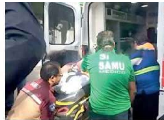
La mujer fue llevada al hospital

Como parte de las investigaciones, el Ministerio Público llevó a cabo el aseguramiento del hospital