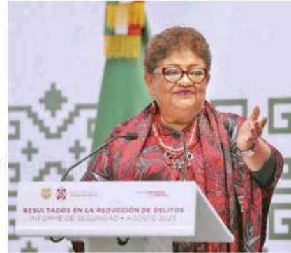
Ernestina Godoy Ramos , titular de la FGJCDMX

La fiscal general mencionó que el trabajo de la FGJCDMX ha permitido disminuir la impunidad y garantizar el derecho a la justicia para las víctimas, mediante el combate a todas las expresiones criminales y sin permitir que la capital del país sea zona de confort para ningún grupo delictivo.