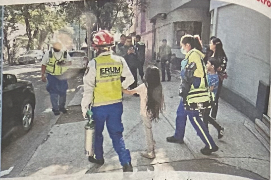
Paramédicos verificaron que los tres sólo presentaban mareos.