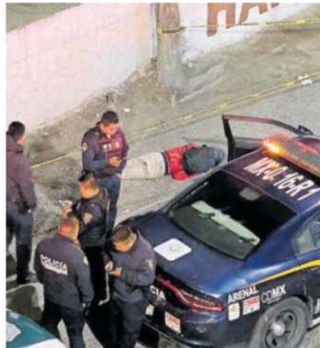
El lugar quedó a resguardo de los uniformados por varias horas