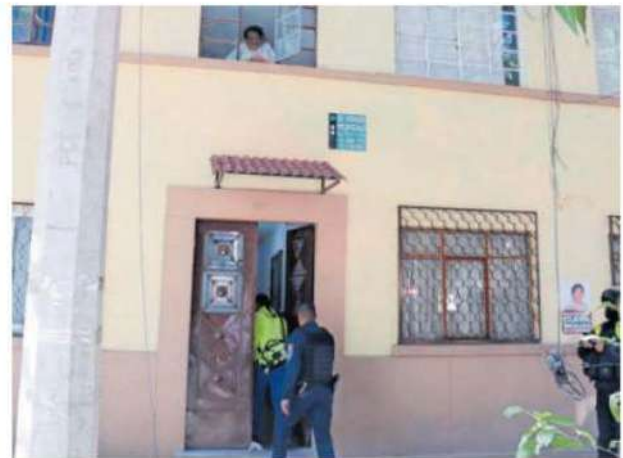
Los hechos fueron en calles de la Colonia San Rafael en la alcaldía Cuauhtémoc

UNA FUGA de gas LP cuando encendieron el boiler causó que dos menores de edad se desvanecieran, la desesperación y el terror se apoderado de la progenitora