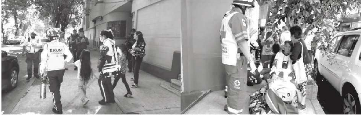
Una mujer y sus dos pequeños hijos fueron salvados por los rescatistas