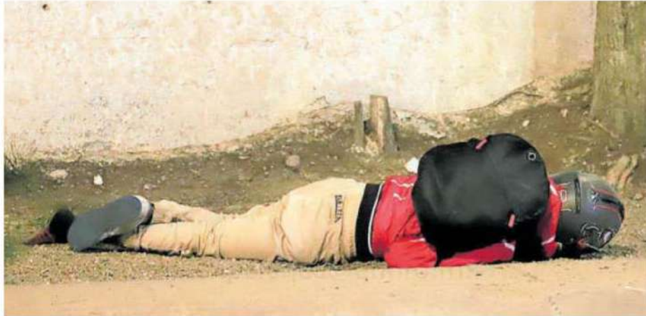
Por arriba de las calles Circunvalación y Río Churubusco perdió el control y chocó contra las vallas de contención