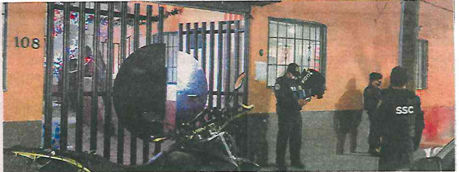
Es el 108 de Magnolia, donde se cree mataron al adolescente

Dicho lugar sería la vecindad marcada con el número 108 de la calle Magnolia, colonia Guerrero de donde salieron los dos adolescentes que cargaban la maleta, donde