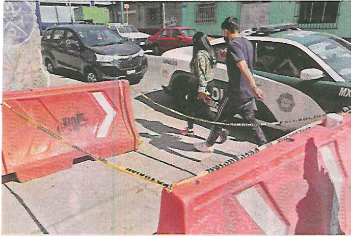
■ Cerca del lugar se hallaron rastros de sangre en la acera.