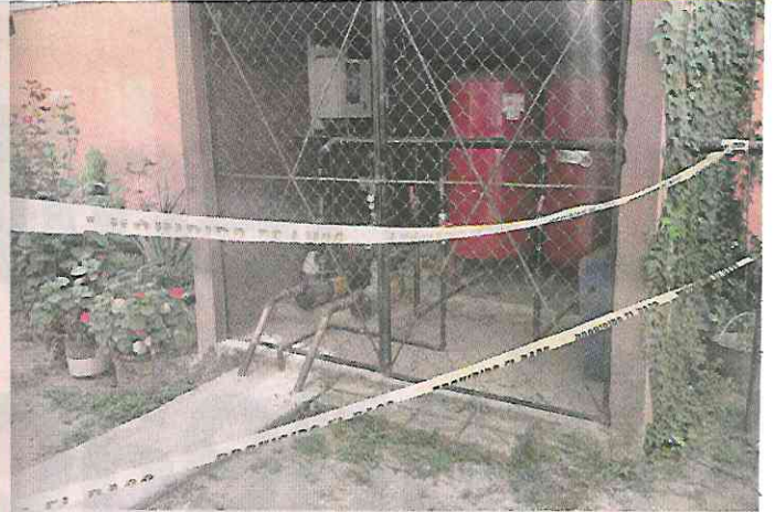
■ Al interior se acordonaron espacios como jardineras.