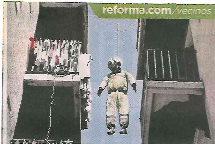
■ Asimismo, una figura colgada destacaba como decoración.