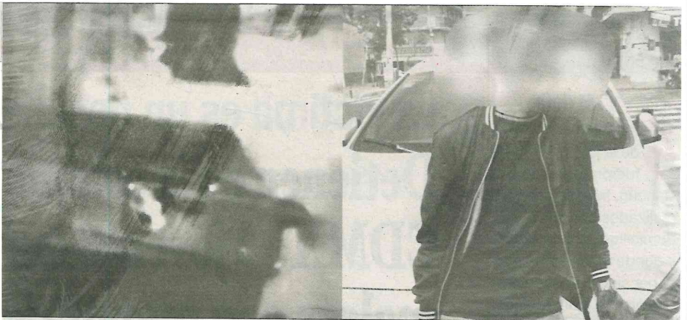
Elementos de la SSC capturaron a dos menores de edad cuando trasladaban una maleta con un cadáver (joven de la foto).