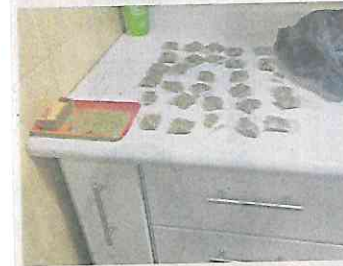
Se hallaron bolsitas de droga listas para su venta.