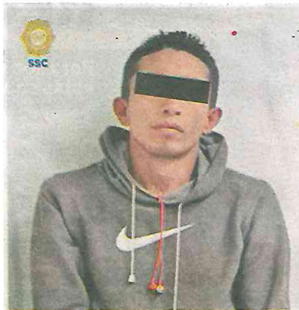
El presunto sería señalado como reincidente delictual

Por lo anterior, al posible implicado le fueron leídos sus derechos de ley y fue presentado ante el agente del Ministerio Público correspondiente, quien determinará su situación legal. Cabe mencionar que, durante el cruce de información, se pudo saber que el detenido cuenta con dos ingresos al Sistema Penitenciario de la Ciudad de México por el delito de robo agravado calificado en el 2014.