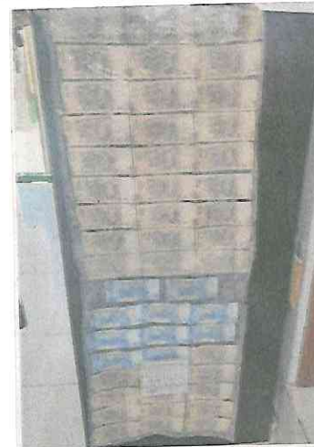
Por la intervención de la SSC se aseguraron 25 mil pesos.

La fiscalía capitalina abrió carpetas de investigación para resolver la situación jurídica de los detenidos.