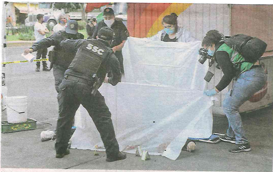
No había comensales cerca de donde cayó la víctima