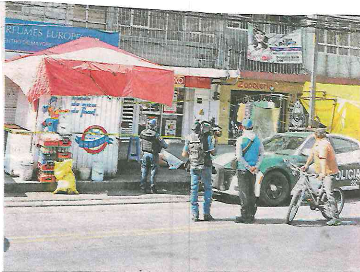
Presuntamente, la víctima tendía ropa cuando resbaló y cayó al vacío

Agentes de la Policía de Investigación (PDI) buscarán hablar con vecinos y comerciantes para obtener más información de la víctima; del mismo modo solicitarán grabaciones de cámaras de seguridad para corroborar si se trató de un accidente o un suicidio.