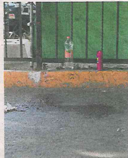
La comerciante recibió los impactos en las costillas y la yugular.