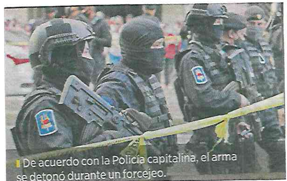
De acuerdo con la Policía capitalina, el arma se detonó durante un forcejeo.

"Fue durante el forcejeo que se disparó el arma del elemento de Seguridad Privada de la empresa y lesionó al sujeto", señaló la Secretaría.