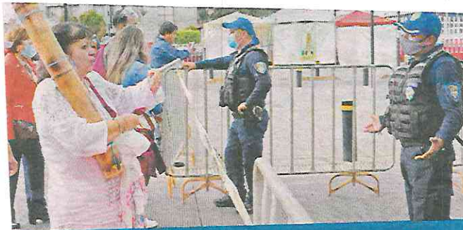
Eran muy pocos los que llegaban a inmediaciones de la Basílica.

Ante las vallas del penúltimo filtro, oraron y en menos de 5 minutos, apurados por el personal del filtro, debieron retirarse.