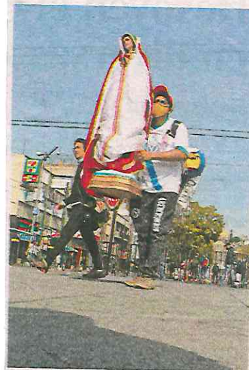
Devotos guadalupanos regresaron contentos tras acercarse lo más posible a la Basílica de Guadalupe

La autoridad capitalina pidió a la población seguir diversas reglas con el objetivo de disminuir los contagios, como el quedarse en casa, si no es necesario salir, para evitar contagios; usar cubrebocas y mantener siempre una sana distancia; no hacer fiestas, posadas o reuniones con amigos y familiares, además de pasar las celebraciones decembrinas con las personas con las que se comparte el mismo domicilio.