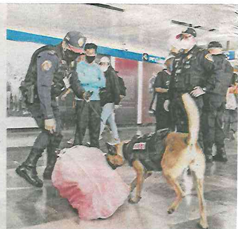
En el Metro, los robos disminuyeron, en promedio, de 13.5 casos diarios a 2.3.