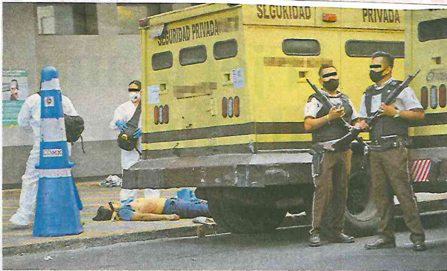
Personal forense realizó el levantamiento del cadáver

Del mismo modo, solicitarán las grabaciones de cámaras públicas y privadas para confirmar o desmentir las hipótesis.