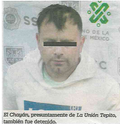
El Chayán, presuntamente de La Unión Tepito, también fue detenido.

los ilícitos de enero a octubre de 2020, con relación al año anterior.