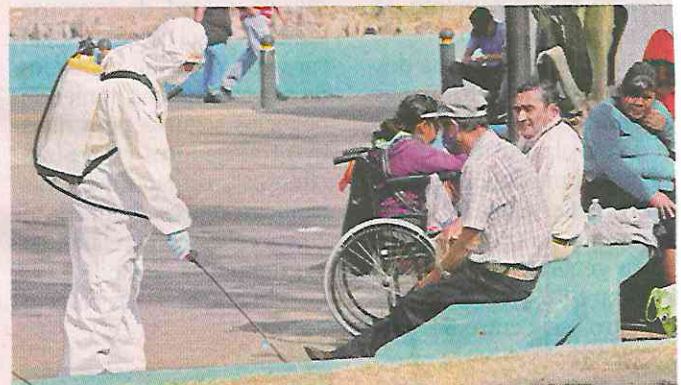
■ Personal de Gustavo A. Madero y de la SSC se encargaban de sanitizar los espacios.

En los filtros dejaban pasar a personas individuales y rechazaban a los grupos. La familia Ramos Mora se separaba y así superó casi todos los filtros, hasta el penúltimo ubicado 100 metros antes de la explanada.