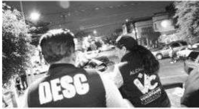
Brinda seguridad a los capitalinos