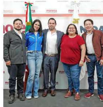
PROMESA. La morenista aseguró que junto con los vecinos de la alcaldía acabarán con la corrupción inmobiliaria.