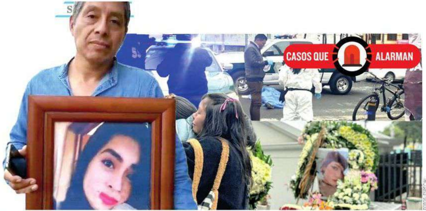
Los accidentes de ciclistas cada vez son más frecuentes