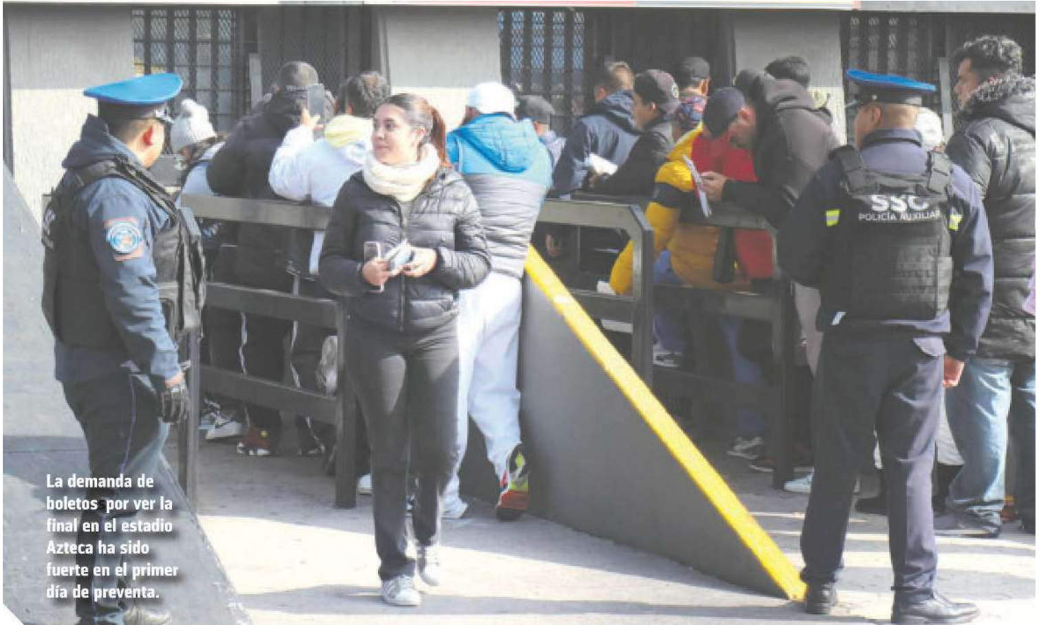
La demanda de boletos por ver la final en el estadio Azteca ha sido fuerte en el primer día de preventa.