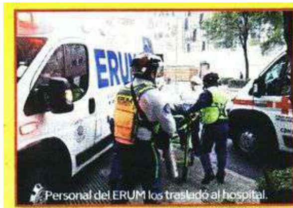
Personal del ERUM los trasladó al hospital.

En el hospital hay personal de LOGRA que cuidaba a los heridos y que se negó a dar detalles del estado de salud de los obreros lesionados.