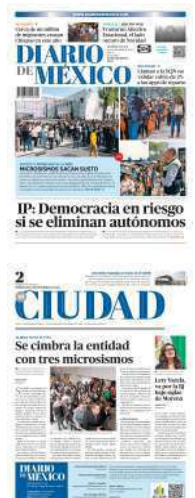
En la Cámara de Diputados aplicaron el desalojo de empleados.