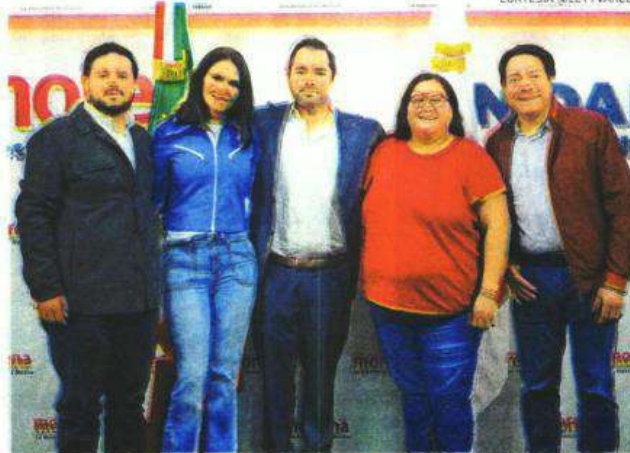
Quiere ganar la contienda

có que la alcaldía Benito Juárez debe tomar otro rumbo; se requiere, dijo, gobernar para todos, acabar con los sectarismos y con los privilegios de unos cuantos y, en