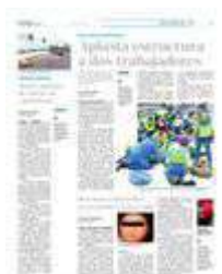
El hecho provocó la movillización de los cuerpos de emergencia