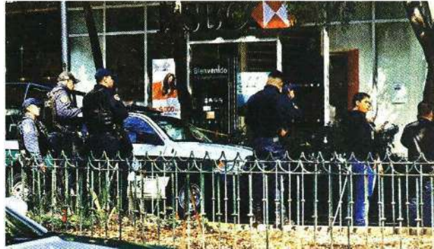
El homicidio se registró la mañana del sábado en la Colonia Hipódromo, Alcaldía Cuauhtémoc.

“El detenido registra un ingreso al Sistema Penitenciario en el año 2021 por el delito de robo simple; además, cuenta con seis carpetas de investigación por robo a transeúnte, daño en propiedad ajena, lesiones por golpes y fraude”, informó la SSC.