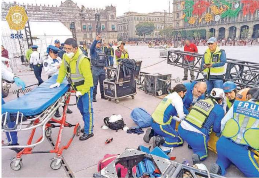
Paramédicos de inmediato revisaron a los dos hombres que se hallaban tendidos en el piso