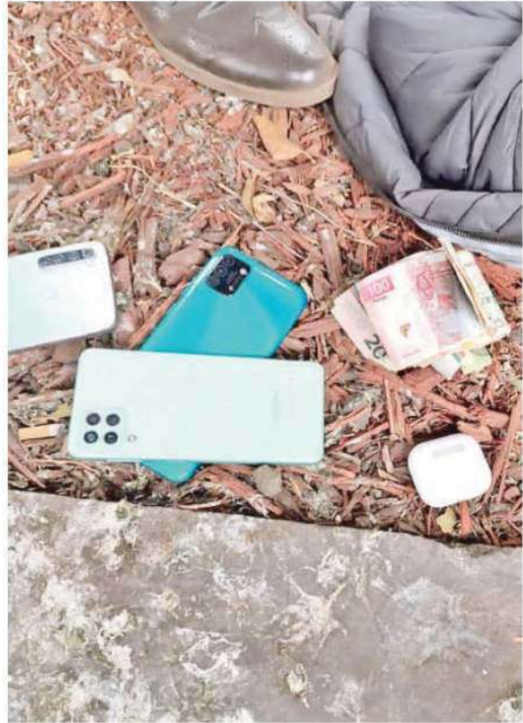
Los dos imputados fueron remitidos ante las autoridades ministeriales de la Fiscalía General de Justicia capitalin