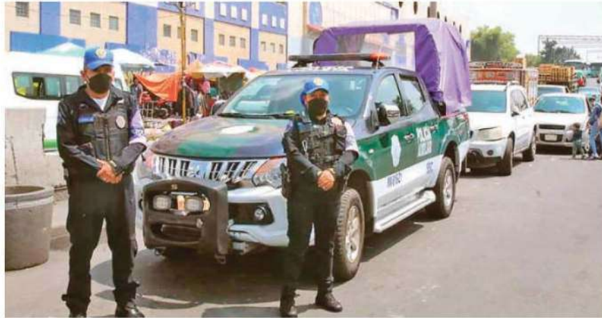
Realizan recorridos permanentes en todos los mercados para evitar la venta de pirotecnia, principalmente en La Merced, Sonora y Jamaica