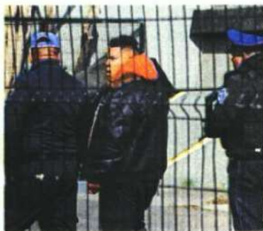
Desbordada, la pasión por la gran final del futbol.