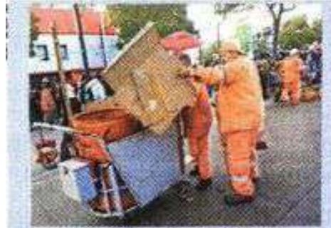
Fieles partían y trabajadores seguían recogiendo desechos.

BASURAL. Asimismo, se reportó que entre el 9 y el 12 de diciembre se recolectaron 765 toneladas de basura que se generaron por la visita de los peregrinos a la Basílica y sus alrededores. Tan solo a su paso por Ecatepec, los miles de peregrinos dejaron más de 250 toneladas de basura.