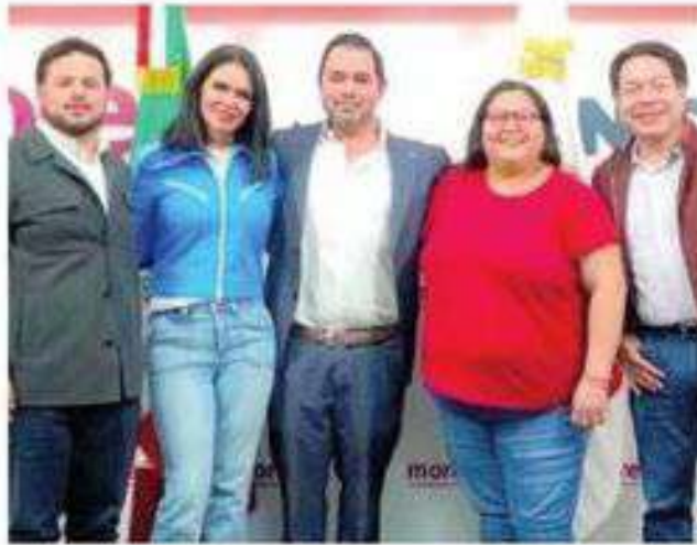
Es la segunda vez que compite por la alcaldía