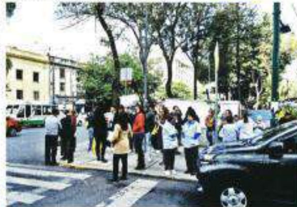
En otras áreas de la Ciudad, como en la Colonia Tabacalera, vecinos evacuaron los inmuebles.