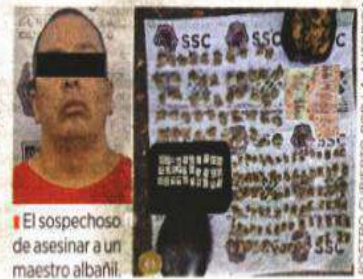
El sospechoso de asesinar a un maestro albañil.

Además de dinero en efectivo, un celular y un casco de motociclista color negro.