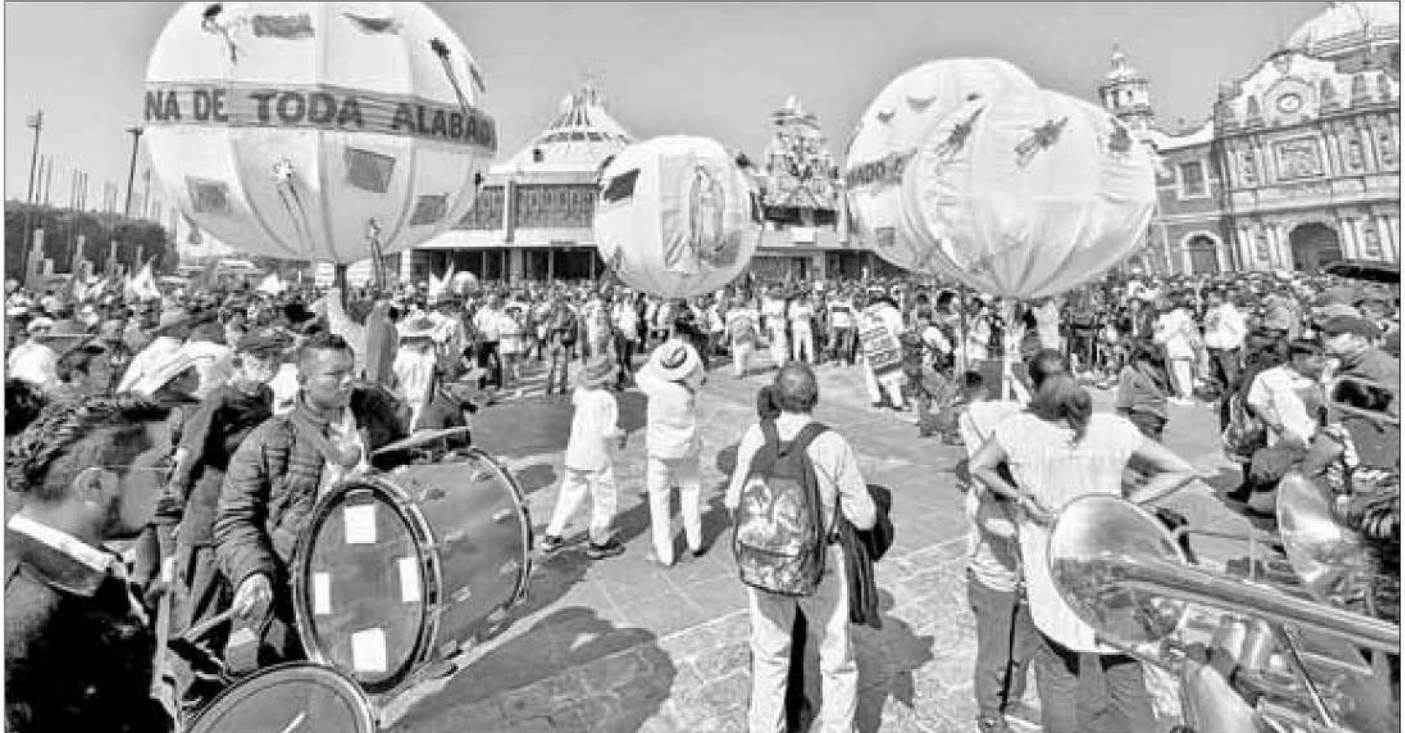
▼ Se otorgaron más de 3 mil 745 atenciones por lesiones.