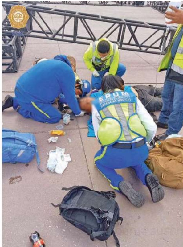
Uno de ellos fue diagnosticado con probable traumatorax y el otro con craneoencefálico severo