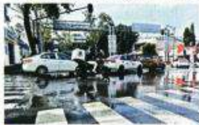
Vecinos de Mixcoac señalaron que en Avenida Molinos, se registró una fuga de agua a causa del movimiento.