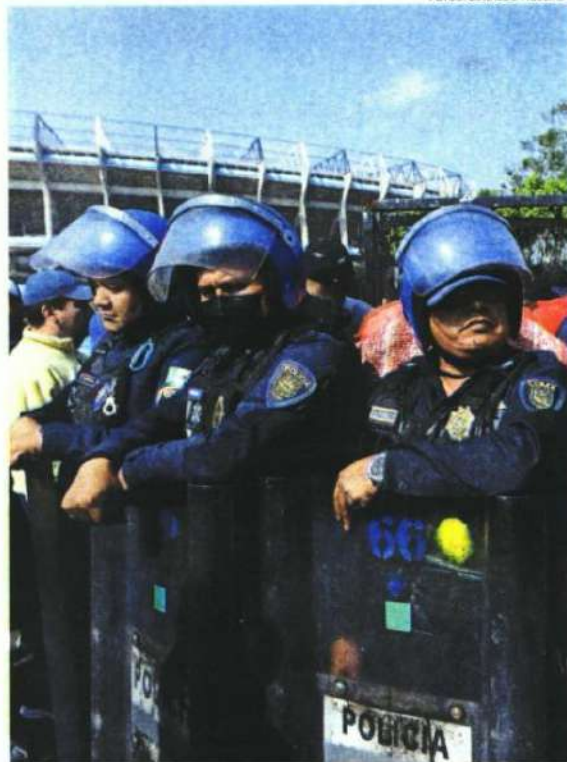
El costo de los boletos en el 'mercado negro' están por las nubes. Lo pagan.

evite que lo saquemos, solamente se atenderán a los abonados", se escuchó decir a uno de los elementos de seguridad privada cerca del inmueble.