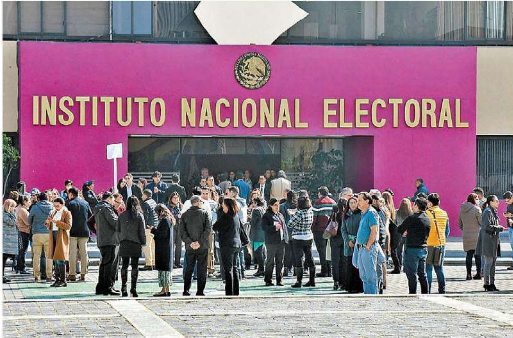
Edificios de la capital fueron evacuados; en la imagen, sede del INE. JUAN CARLOS BAUTISTA

En menos de cinco minutos se reportaron tres movimientos telúricos