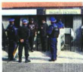
Hay expectación desbordada por la serie entre América y los Tigres.