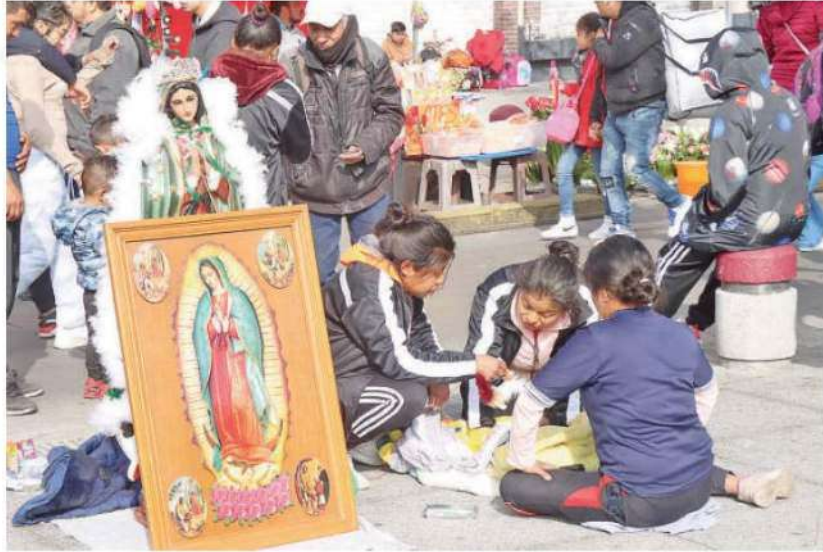
El operativo se mantendrá hasta el miércoles 13 de diciembre, cuando se tenga un desaforo total