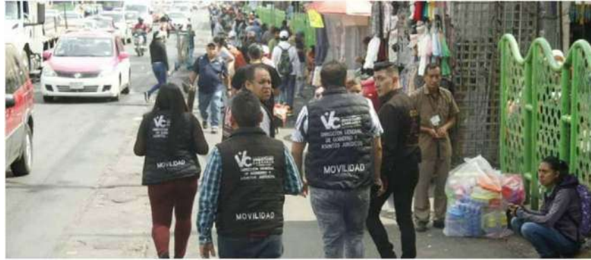
Se realizaron recorridos coordinados con ayuda de la SSC, la Guardia Nacional y la Policía de la alcaldía.