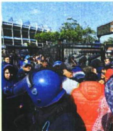
Los revendedores no se hicieron esperar.

"Aquí solo hay venta para abonados. Los que tengan socio azulcrema sólo es por internet, la venta general es el jueves,