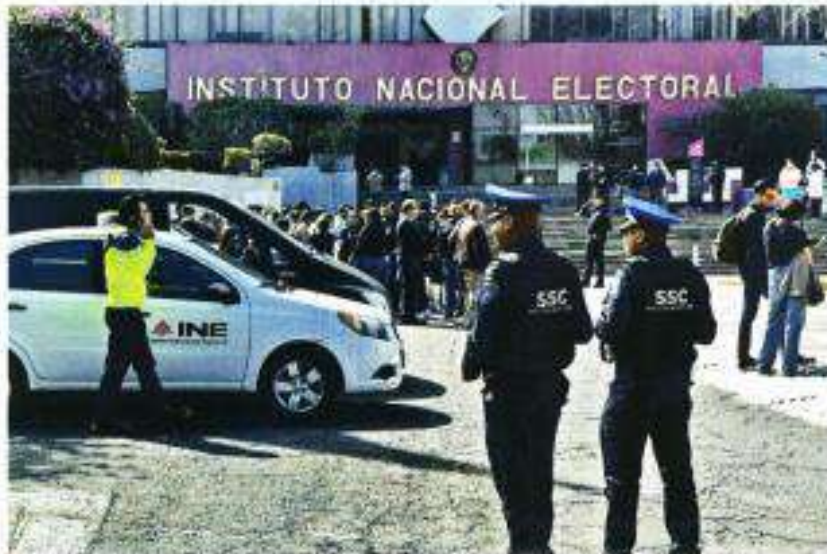
Tal registrarse las sacudidas en la Ciudad de México, inmuebles fueron desahuyados como medida de prevención.

Pese a que las autoridades capitalinas descartaron daños por los cuatro microsismos de ayer, la Alcaldía Benito Juárez evacuará ocho inmuebles por prevención