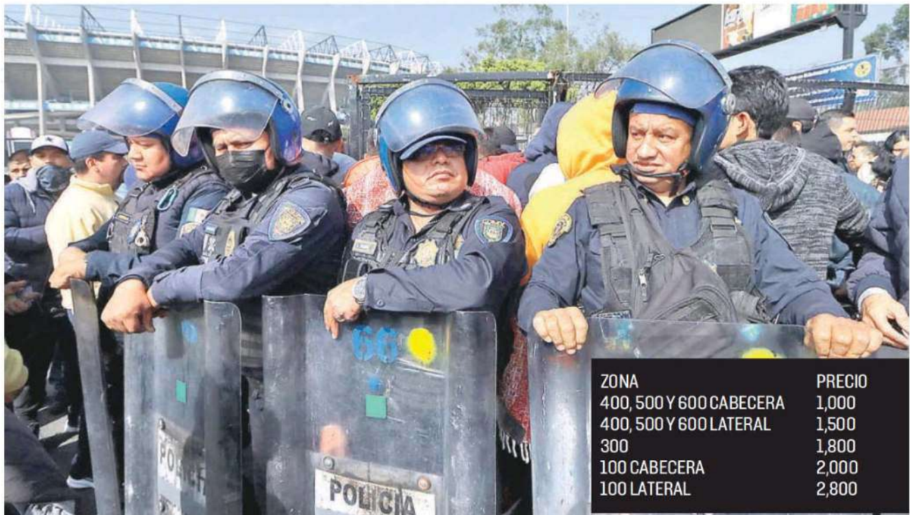
Golpes, rasguños y caos se vivió en el primer día de venta para los boletos de la final en el Azteca. OSWALDO FIGUEROA