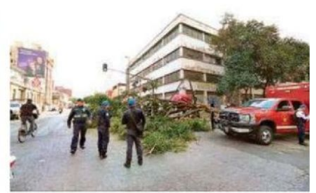
Un puesto de cócteles de frutas que estaba a un lado del enorme árbol quedó destruido; vendedor y clientes resultaron ilesos