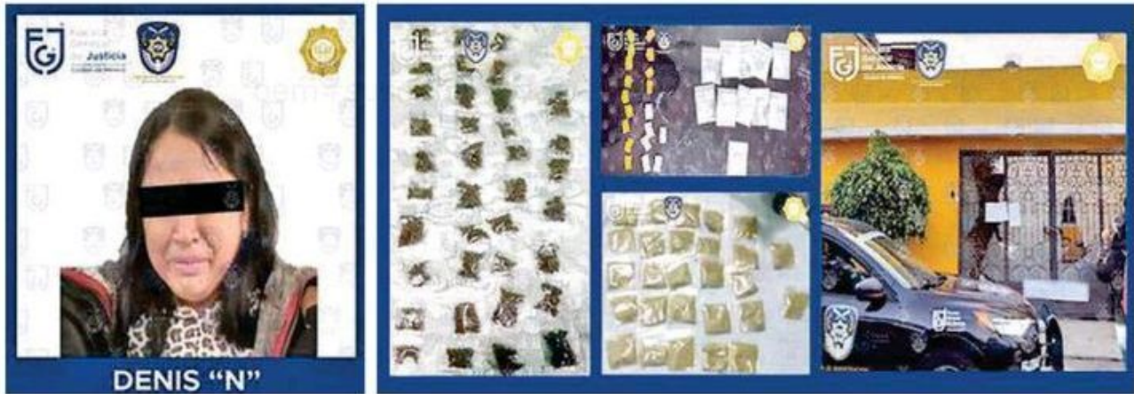
En un posible punto de venta de droga en la colonia San Juan de Aragón, la Fiscalía General de Justicia de la Ciudad de México decomisó varias dosis y detuvo a una mujer