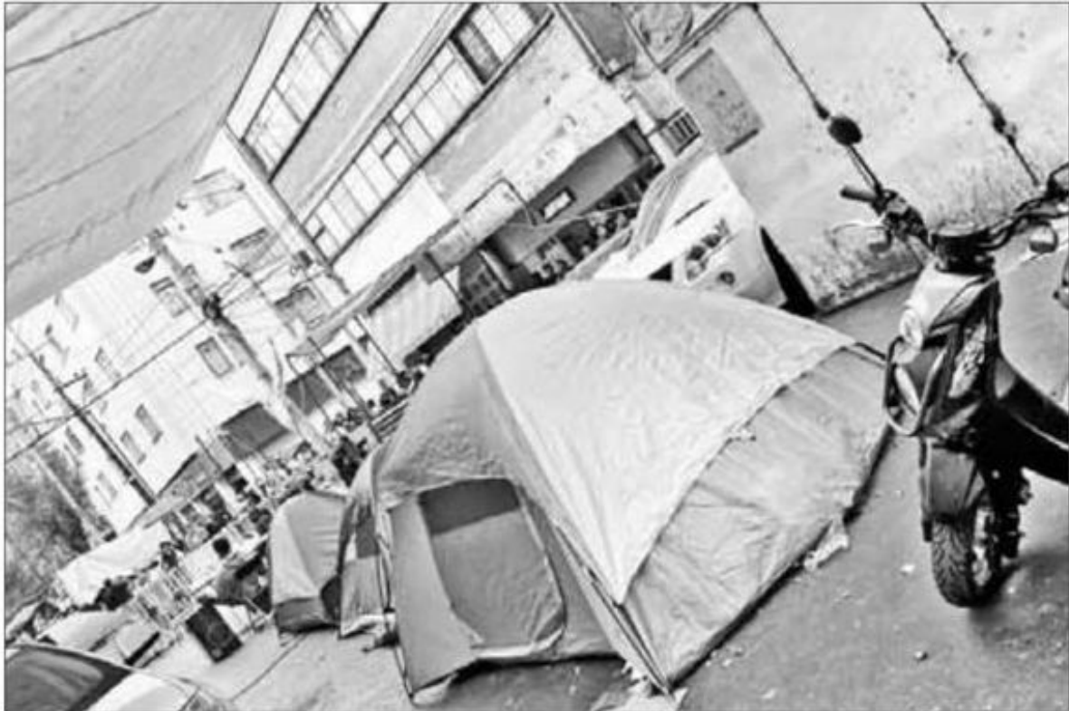
▲ Vecinos de los afectados han sido solidarios con comida, agua y ropa mientras esperan una respuesta.