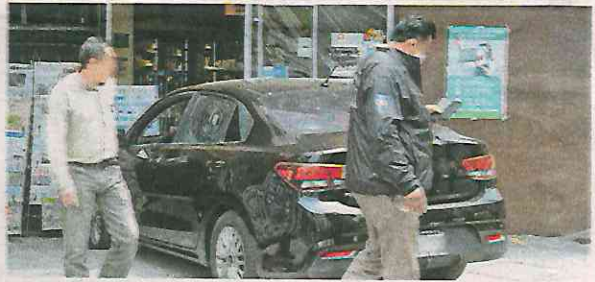
Lo sorprendieron a tiros dos delincuentes motorizados

“Un chavo venía entrando y alcanzó a brincar para meterse a la tienda, si no sí lo hubiera prensado”, comentó uno de los empleados de la tienda de conveniencia.