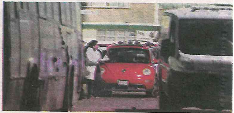
En este auto viajaban las víctimas

ros les atravesaron el vehículo negro y del otro automotor descendieron dos sujetos que comenzaron a dispararles.