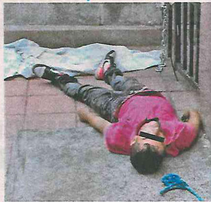
Pendiendo de lazo fue visto por los vecinos, quienes lo bajaron

Socorristas del Escuadrón de Rescate y Urgencias Médicas (ERUM), llegaron al lugar de los hechos para revisar a la víctima y brindar los primeros auxilios, pero solo pudieron confirmar la ausencia