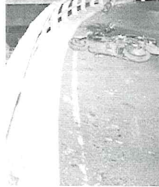
La moto quedó arriba del puente

La motoneta quedó en la parte de arriba del puente y el cuerpo cayó sobre Periférico Calle 7, hasta donde llegaron elementos del Sector Arenal de la SSC para abanderar el lugar y permitir las labores de los peritos de la Fiscalía capitalina.