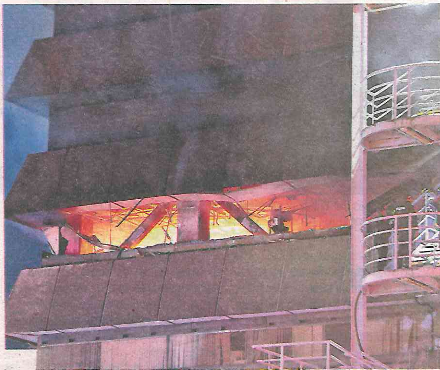
Incendio en el edificio de Sobse, ubicado en Avenida Universidad, colonia Santa Cruz Atoyac

Al respecto, la Fiscalía General de Justicia de la Ciudad de México (FGJCDMX)