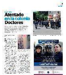
La víctima falleció mientras recibía atención urgente en el Hospital del IMSS Magdalena de las Salinas.