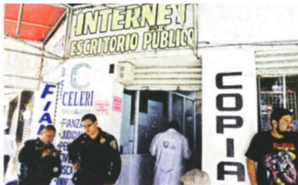
El ataque contra la abogada se cometió en la esquina de Doctor Jiménez y Doctor Claudio Bernard, Colonia Doctores.