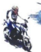
Un atacante huyó en moto.

A pesar de que cámaras de vigilancia captaron a los agresores, estos no fueron detenidos.