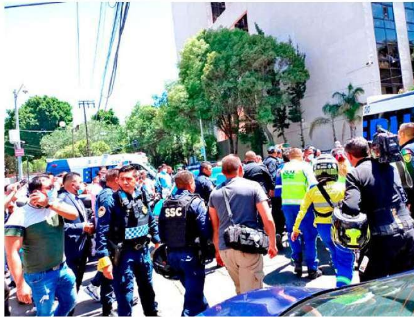
MIEDO. Una gran movilización se presenció en la colonia Doctores luego de que un sujeto le disparara a una mujer dentro de un local.