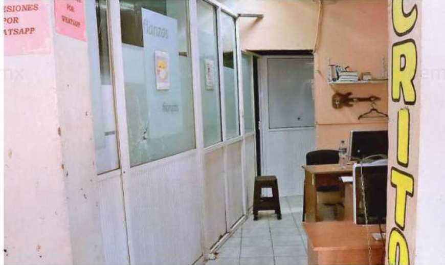
El presunto homicida sacó un arma de fuego y disparó contra la abogada en por lo menos 2 ocasiones, logrando escapar junto con otro sujeto