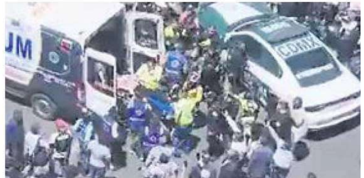
Ataque. Autoridades y la ambulancia, ayer, en el lugar del homicidio

La autoridad interroga a testigos de los hechos y revisa cámaras de vigilancia para identificar a los asesinos y detenerlos. —David Saúl Vela