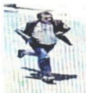
Por el crimen no hubo detenidos.