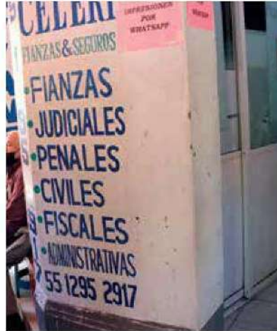
Los responsables llegaron a los escritorios públicos donde la abogada se encontraba trabajando, para abrir fuego.