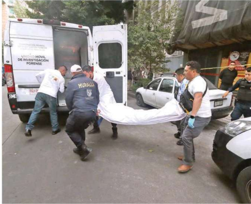
Sus compañeros intentaron auxiliario, pero al notar que este presentaba lesiones de consideración llamaron al 911