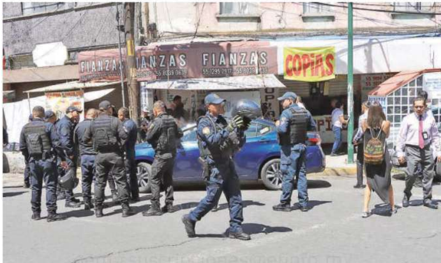
La víctima , tras recibir los disparos, se desvaneció al interior del lugar con razón social Celeri Finanzas & Seguros, ante la mirada de empleados y colegas