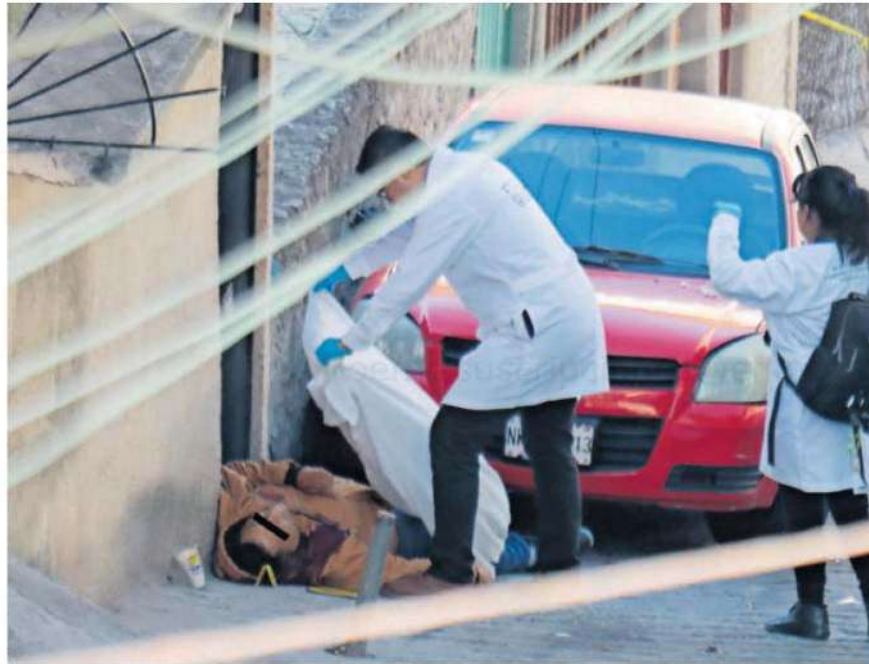
Los socorristas ya nada pudieron hacer pues las balas que habían hecho blanco en su cuerpo le quitaron la vida al instante