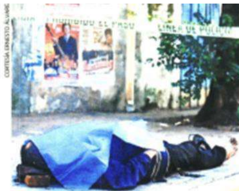
El sujeto no llevaba puesto un zapato; nadie lo identificó.