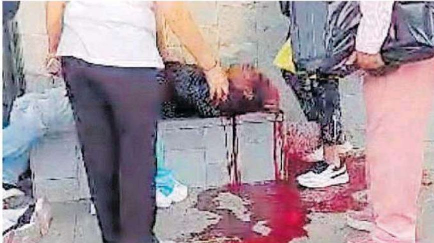
Ambos sujetos se encontraban platicando cuando dos individuos a bordo de una moto se acercaron a ellos y fueron atacados /FOTOS: CAPTURA DE VIDEO