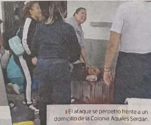
■ El ataque se perpetró frente a un domicilio de la Colonia Aquiles Serdán.