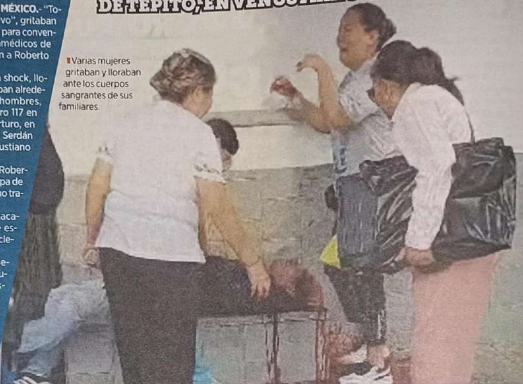
SANGRE DE SU SANGRE