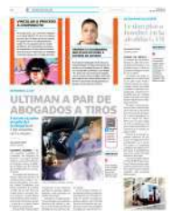
Lo persiguieron para rematarlo