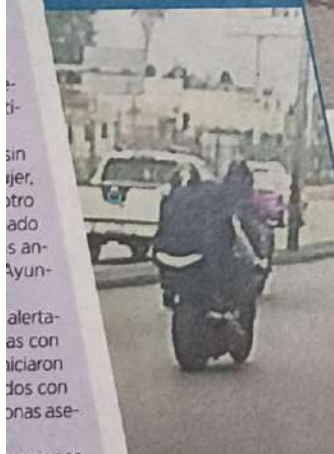
■ Los asesinos escaparon en una motocicleta negra.