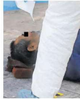
El adulto mayor que se encontraba sobre el pavimento con un pie descalzo