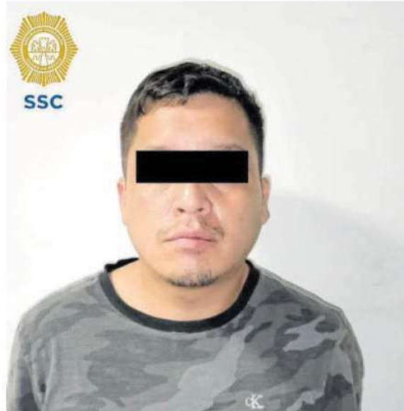
Fue detenido en la GAM, el tercer posible responsable en el robo a la joyería, iba acompañado de otro de la misma nacionalidad