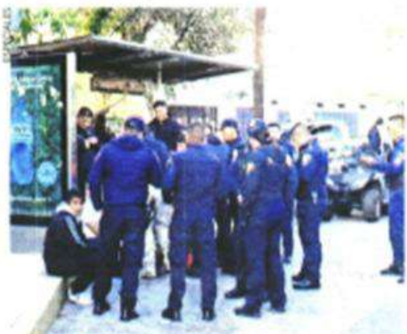
Varios patrulleros acudieron atender la emergencia.

fueron trasladados al hospital por paramédicos de Protección Civil (PC), un pasajero y dos oficiales.