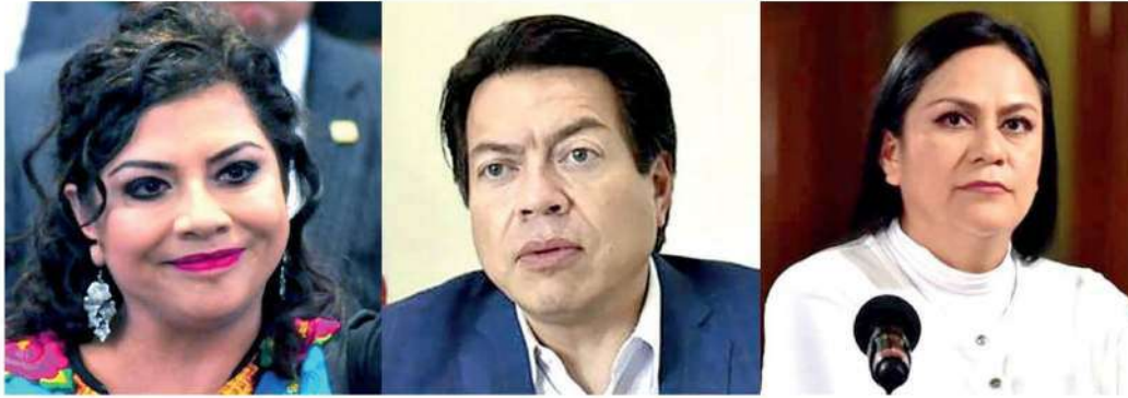
Clara Brugada, Mario Delgado y Ariadna Montiel alzarón la mano