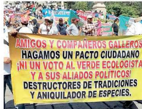
Lanzaron consignas en contra del PVEM

Hicieron un llamado para que no se penalice ni criminalice esta práctica, pues se trata de una tradición