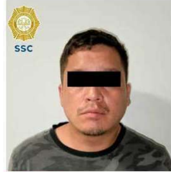
CÓMPLICE. Luis Ángel N., de nacionalidad colombiana, cuenta con dos ingresos al Sistema Penitenciario.

Cabe recordar que las autoridades ya detuvieron a otros dos sujetos vinculados al robo de la joyería, entre ellos el autor intelectual.