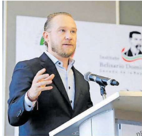
Los capitalinos no pueden estar condenados a vivir con miedo, afirma el titular de BJ

Dijo que la política de proximidad con la ciudadanía es fundamental y ha contribuido a generar una percepción positiva, a tal grado, de darles su tarjeta durante la pandemia para retirar efectivo. “Fijense lo que logramos con Blindar, los adultos mayores le daban su tarjeta al policía, iban y les regresaban su tarjeta y el dinero, eso es construir confianza”.