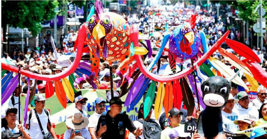
DAÑOS. Los inconformes denunciaron que la norma impulsada por el diputado de la Alianza Verde en el Congreso local atenta contra el empleo de miles de familias dedicadas al criadero de aves