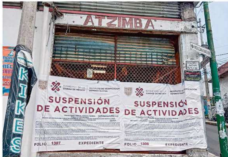
CERRADO. Autoridades capitalinas llevaron a cabo la inspección de negocios que vendieran madera para constatar que estuvieran reguladas.