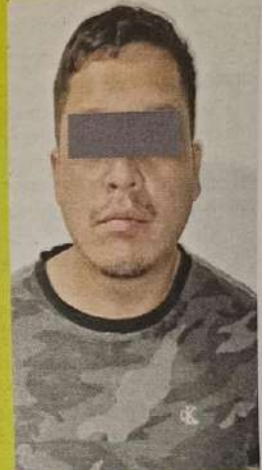
El tercer implicado en el robo a la joyería.