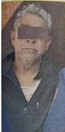
El asaltante de transporte público, detenido.

El agresor sacó una navaja y lesionó a dos uniformados, pero al final fue detenido y los tres heridos, llevados a un hospital.