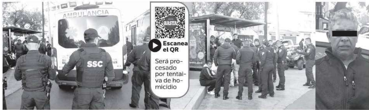
Gran movilización policíaca ñprovocó el iracundo delincuente