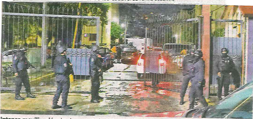
Intensa movilización de elementos de la Secretaría de Seguridad Ciudadana

Aproximada- mente 100 uniformados capitalinos desplegaron un fuerte operativo de seguridad en la zona, misma que es conocida por mantener una alta incidencia delictiva