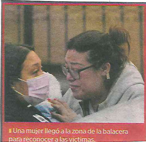
Una mujer llegó a la zona de la balacera para reconocer a las víctimas.