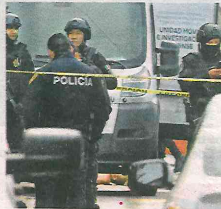
Balacera en Iztapalapa con saldo de tres muertos y un herido

A la llegada del cuerpo de emergencias, los paramédicos certificaron la muerte de los tres individuos; mientras que a otro sujeto que también fue alcan-