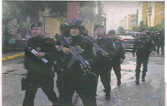
Agentes de la SSC acudieron a la Unidad Habitacional Teatinos, luego del reporte de detonaciones de arma de fuego.