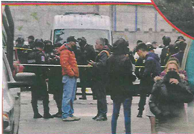
El área fue resguardada por más de 60 elementos de la SSC.

Esas unidades tienen seguridad para entrar, dicen que algunos de los muertos sí eran vecinos. Que andaban chupando y se empezaron a pelear y un güey sacó la pistola”