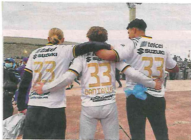
Muchos querían ver a Dani Alves por primera vez contra las Águilas.

cieron sentir y América les pagó su apoyo de la mejor manera: adueñándose de CU con victoria y goleada. Ante este resultado, los seguidores auriazules mostraron su inconformidad con abucheos y silbidos, aunque otros se mantuvieron firmes.