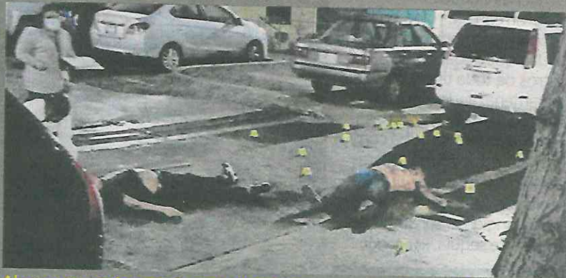
Al menos una docena de casquillos fueron encontrados en el lugar.

Según los informes de la Secretaría de Seguridad Ciudadana capitalina (SSC-CDMX), varias personas ingerían bebidas alcohólicas en el lugar, cuando arribaron cinco sujetos e iniciaron una riña en la que salieron a relucir armas de fuego.