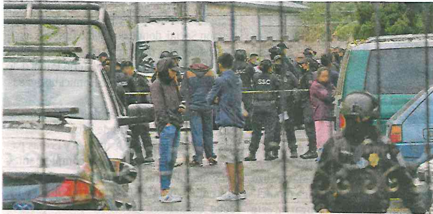
Elementos de la Fiscalía capitalina arribaron al lugar cerca de las 6:00 horas, para realizar el levantamiento de los cadáveres