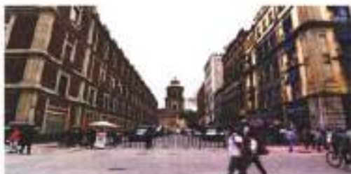
Si bien se se permitirá el ingreso a la plaza del Zócalo en las fiestas patrias, se establecerán restricciones que solo se aplican con autorización.

"Queremos buscar de la manera de que se pueda seguir por ciertos recorridos. Estamos a un año de la ciudadanía y pedimos disculpas a los comerciantes y empresarios de la zona del Centro Histórico, sabemos que es una situación difícil, pero en este tiempo, del 15 al 27 de sep-