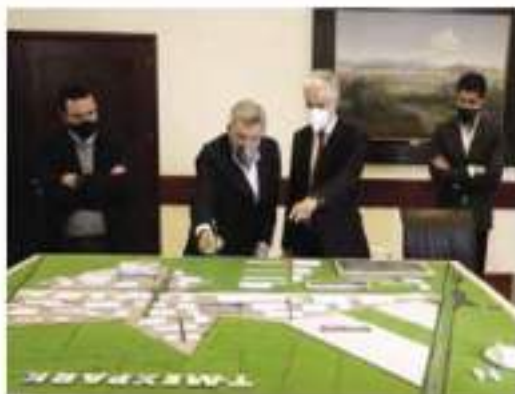
TOLUCA, Edomex.- Alfredo Del Mazo. Más inversión y empleo para los mexiquenses.

Al momento, se han entregado 348 patrullas de 500 que se tienen como objetivo.