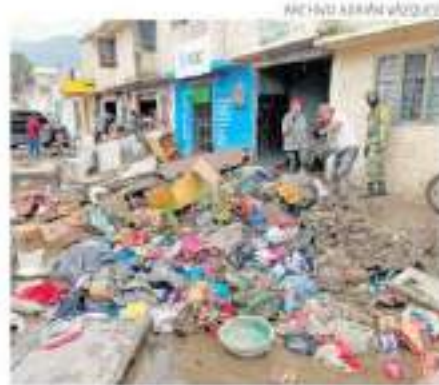
Las brigadas irán casa por casa a registrar daños

Una vez que concluyan el censo, los apoyos serán entregados exclusivamente por personal de la Secretaría de la Defensa Nacional. Las familias afectadas recibirán apoyo para limpieza de casas y recuperación de enseres.