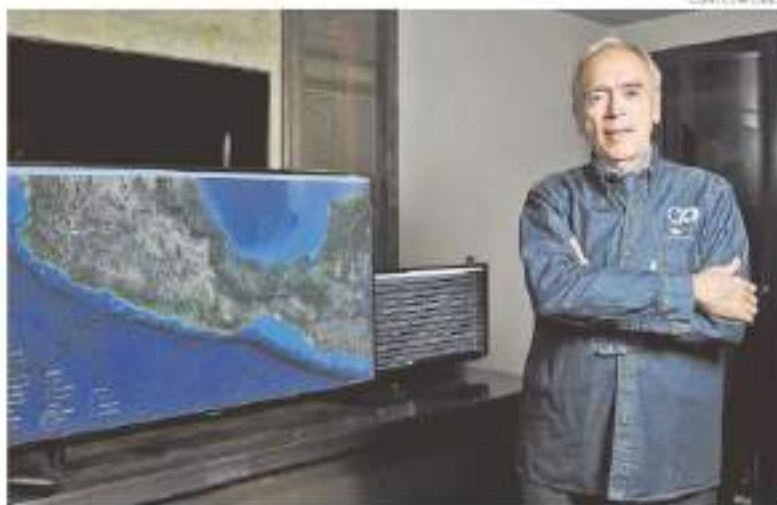
El ingeniero también adaptó su labor debido a la pandemia por Covid-19

"Vivo en un piso B, pero ya no me bajo, mejor me quedo a ver el horizonte del río como brillan los chispas de los cables de luz, que la gente se espanta porque piensa que son fricciones de la corteza terrestre, pero no es así, es una ciudad que tiene una red de distribución de energía muy dispersa y cuando hay sismo pues los cables se tocan y hacen ruido y por eso se ven