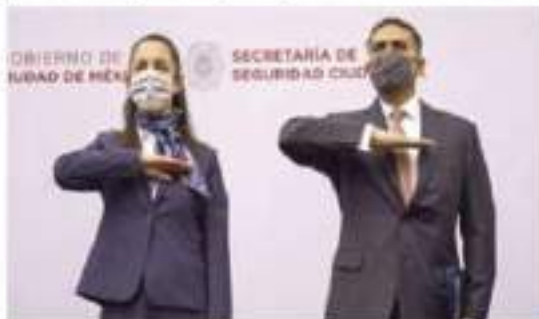
Claudia Sheinbaum y Omar García Harfuch.

Del Mazo Maza indicó que este desarrollo beneficiará a las familias de la región de Zumpango, Tultitlán, Toluca, Tlaxiaco, Tlaxiaco, Tlaxiaco y Tlaxiaco, que es la zona donde se construye el nuevo Aeropuerto Internacional "Félix Ángeles".