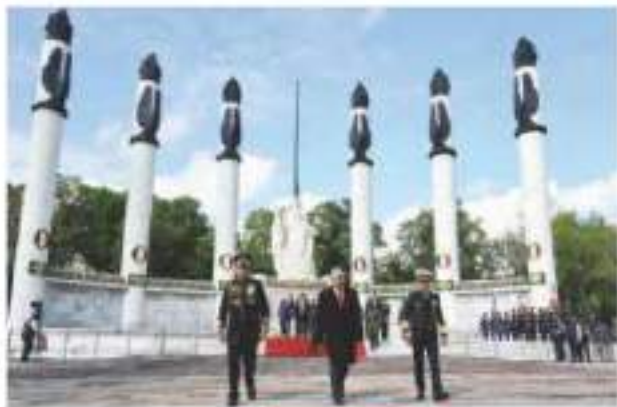
EL PRESIDENTE, ayer, saliendo por el secretario de la Defensa y por el de la Marina.