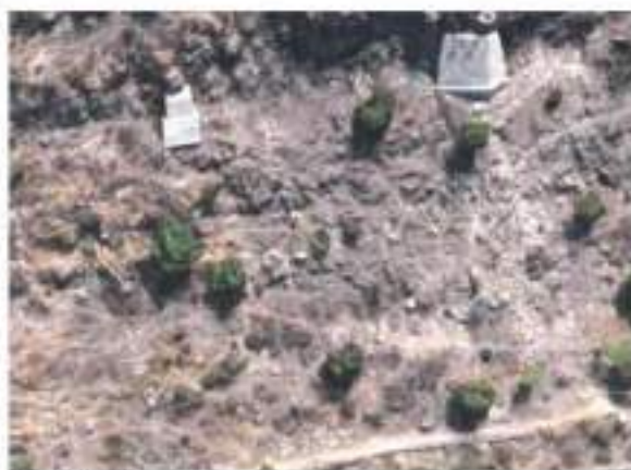
LA ZONA ha tenido intentos de apuntalamiento, con bloques de concreto y otros elementos.

La Pastora, viven aproximadamente 80 mil personas.