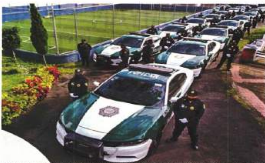
La estrategia del gobierno local en las alcaldías con más incidencia delictiva fue crear más patrullas para la vigilancia en calles.

Se estudia de que realicen su vida en los sectores de Santa Fe, Plateros, Alpes y San Ángel, todos con sus respectivos