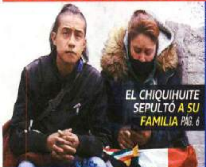
EL CHIQUIHUITE SEPULTÓ A SU FAMILIA PÁG. 6