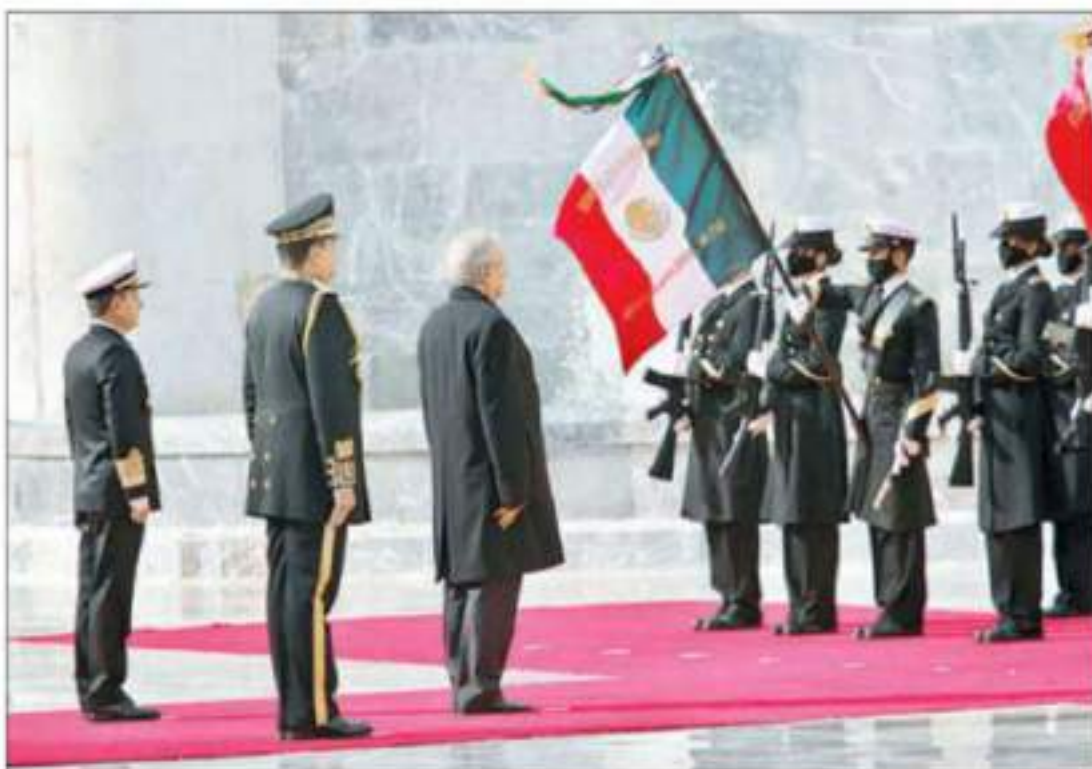
A. El presidente Andrés Manuel López Obrador encabezó ayer la ceremonia de homenaje a los Niños Héroes de Chapultepec en el