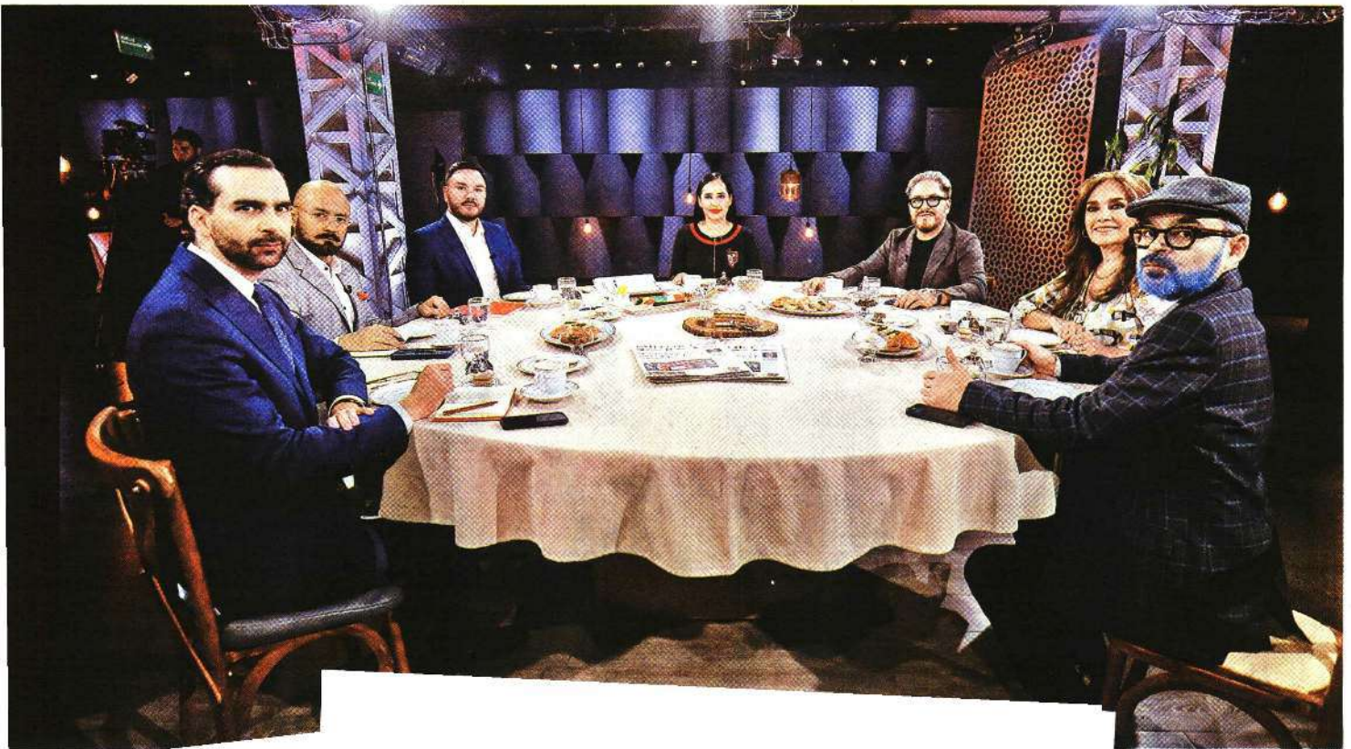
Periodistas del Grupo MILENIO Multimedia y la gobernante.