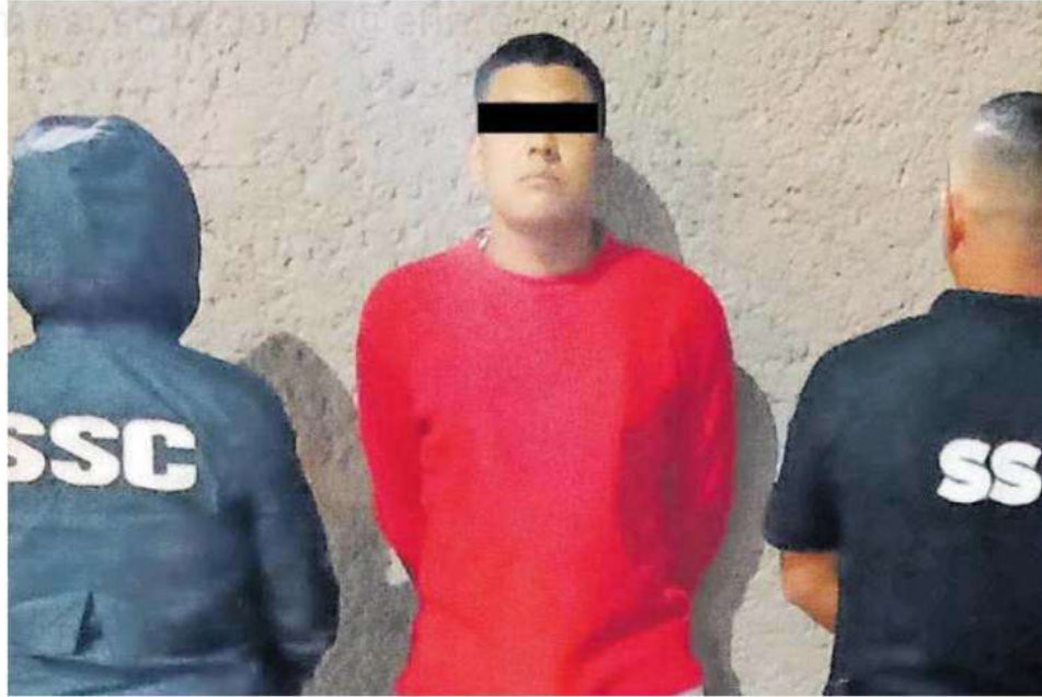
Es señalado de participar en los delitos de narcomenudeo, tráfico de armas, extorsión, cobro de piso y secuestro en la zona norte de la CdMx