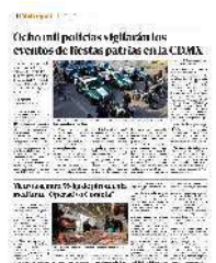
Ocho mil policías vigilarán los eventos de fiestas patrias en la CD.MX.

La Gerencia de Seguridad Institucional del Metro mantendrá una estrecha coordinación con diversas autoridades, incluyendo la SSC, la Fiscalía General de Justicia de la Ciudad (FGJ) y Justicia Cívica (JC), así como con otras dependencias del gobierno capitalino, para garantizar el óptimo desarrollo de las acciones conjuntas que surjan del operativo. ● (Gerardo Mayoral)