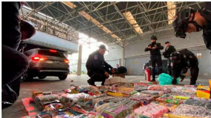
El Metro hizo un llamado a los usuarios a evitar llevar pirotecnia en sus instalaciones.