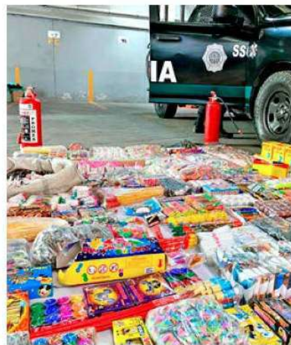
CONFISCAN. Los artículos decomisados se entregan a elementos de la SSC para su destrucción.

niente por la ingesta de alcohol o de alguna sustancia tóxica que les pueda poner en riesgo dentro de las instalaciones o bien, provocar algún tipo de incidente con otros usuarios.