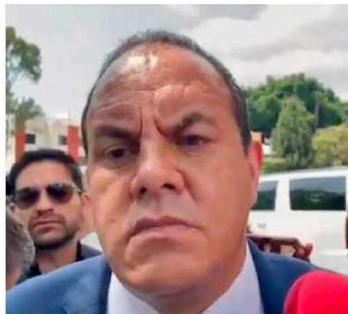
PREPARADO. El gobernador de Morelos solicitará licencia al cargo para competir por la capital del país

Aclaró: “Nosé si vaya a ser el favorito de Claudia (Sheinbaum) pero los que deciden son la gente por eso vamos a competir”. /QUADRANTÍN