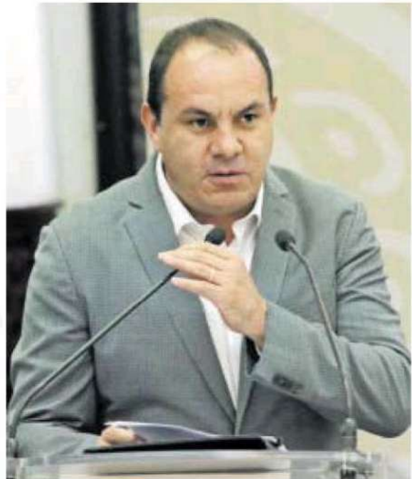
Crece interés del ex futbolista.