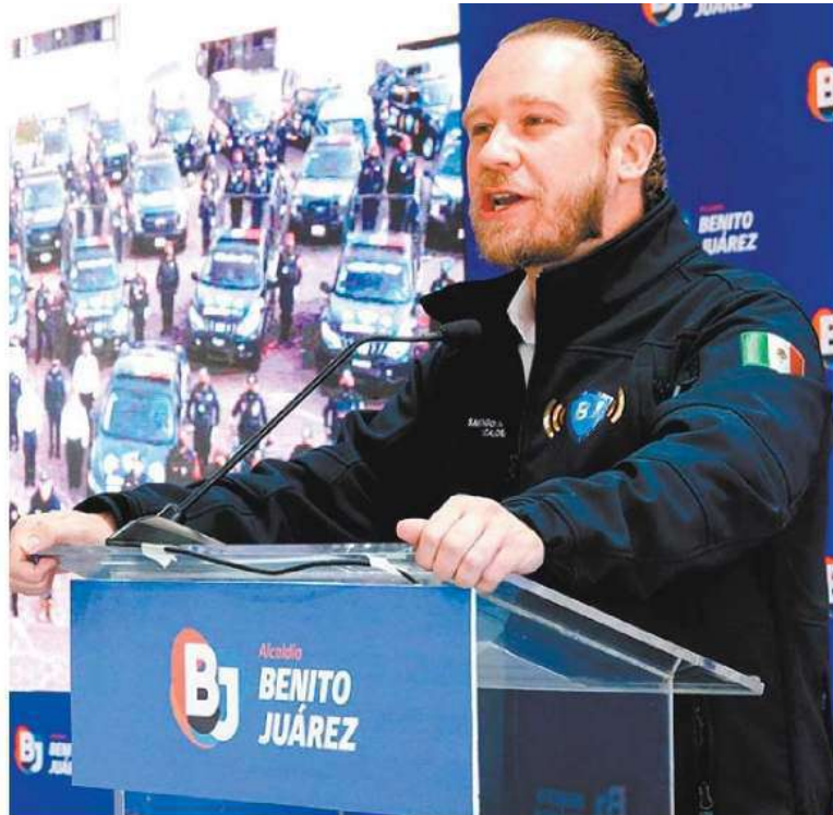
⊕ El alcalde panista avisó que pronto solicitará licencia a este cargo.

Radio Fórmula recordó que de acuerdo con PollsMx, que lleva a cabo un modelo que jerarquiza la fuerza política de los aspirantes a la Jefatura de Gobierno tomando en cuenta careos públicos e hipotéticos entre rivales de diferentes partidos, la relevancia mediática y conversacional de las casas encuestadoras. Taboada Cortina se ubica en tercer lugar hacia el Gobierno de la Ciudad de México, detrás de García Harfuch, que va en primer lugar, y Clara Brugada Molina, alcaldesa de Iztapalapa con licencia, quien se posiciona en el segundo peldaño.