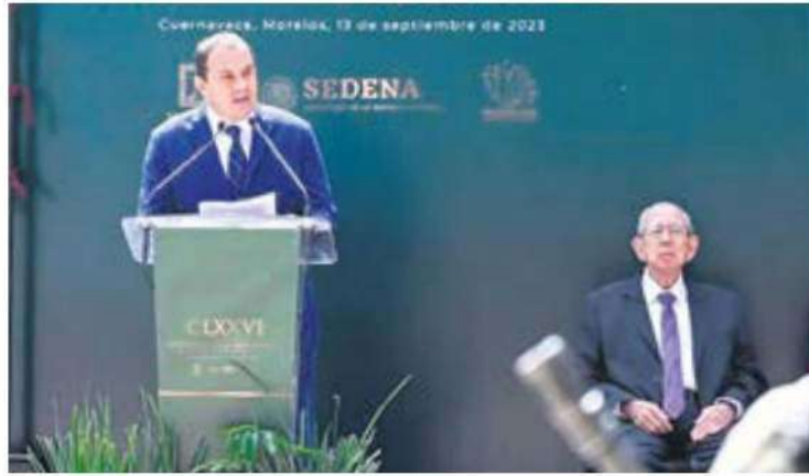
Aspirante. Cuauhtémoc Blanco, ayer, en la ceremonia por los Niños Héroes.