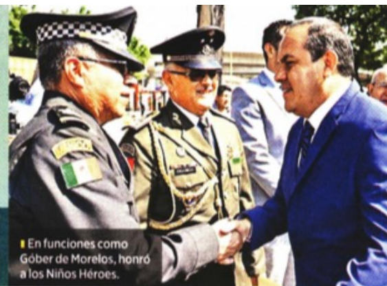
En funciones como Gobernador de Morelos, honró a los Niños Héroes.

... Agregó que Morena lo quiere como candidato a la Alcaldía de Cuauhtémoc, pero él no aspira a ese cargo ni a ser senador.