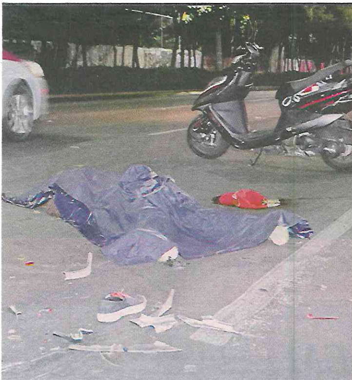
A unos metros de la moto quedó sin vida la chica, en la Colonia Doctores.