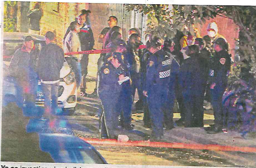
Ya se investigan los indicios que lleven a la captura de los asesinos

En tanto, agentes de la Policía de Investigación de la Fiscalía General de Justicia de la Ciudad de México entrevistan a familiares del ahora occiso, a fin de conocer los motivos por los que fue ultimado, así como para localizar y detener a los responsables.