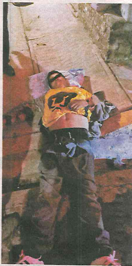
El cuerpo quedó frente a su casa, en Torres de Padierna

La noche del pasado lunes un hombre de aproximadamente 40 años de edad, re-