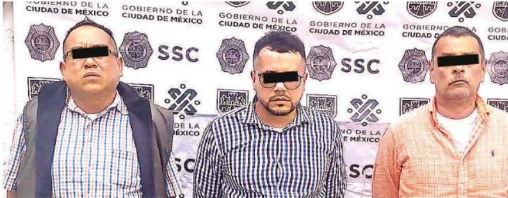
Los imputados Diego "N", Alejandro "N" y José Luis "N"