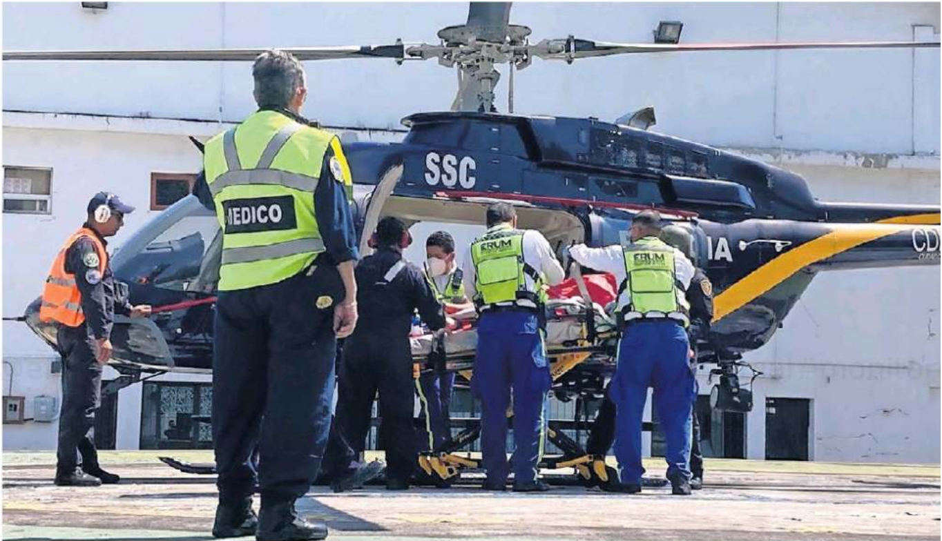
Una niña intoxicada fue trasladada en helicóptero, desde Topilejo, al Hospital Infantil Federico Gómez para ser atendida.