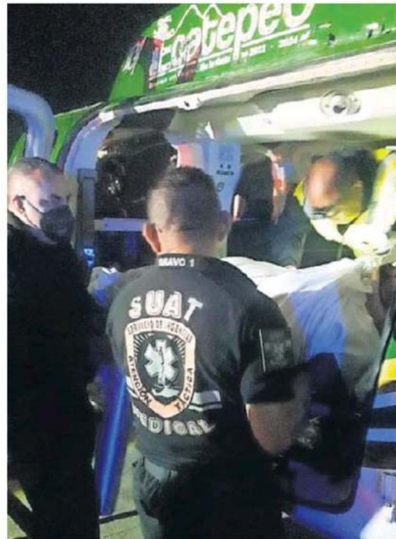
Una niña recibió disparos y fue llevada en helicóptero desde Ecatepec a un hospital en la GAM.

de Servicios Aéreos Cóndores, en conjunto con paramédicos del Escuadrón de Rescate y Urgencias Médicas (ERUM). ●