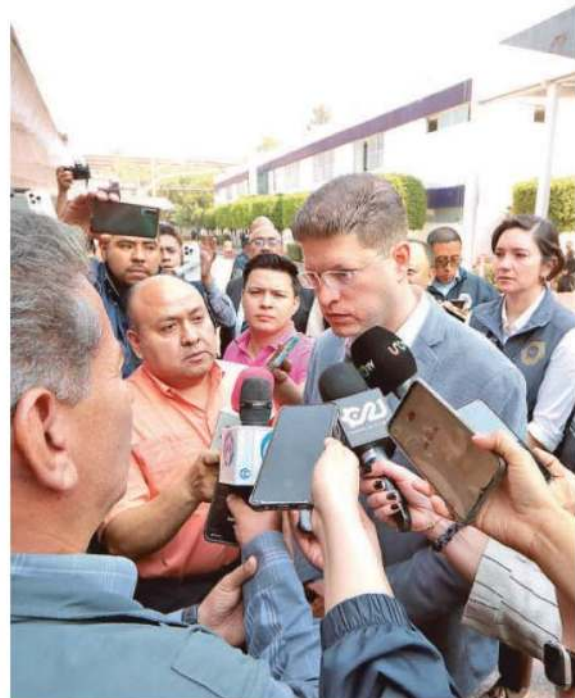
El titular de la SSC aseguró que, en su trabajo conjunto con la FGJ, no se detendrán hasta hacer justicia

Al no darle seguimiento al caso, dos agentes del Ministerio Público, identificadas como Karen "N" y Gabriela "N", fueron suspendidas y se encuentran bajo investigación.