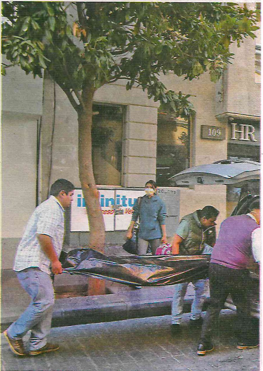
Hasta el momento se desconocen las causas de la muerte

La zona quedó a resguardo de elementos de la Secretaría de Seguridad Ciudadana SSC, a la espera de peritos de la Fiscalía General de Justicia quienes tras concluir las diligencias trasladaron el cadáver al anfiteatro correspondiente.