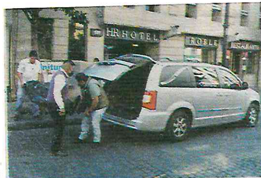
• Un misterio las causas de su deceso

Autoridades investigan las causas del deceso de la mujer de la tercera edad