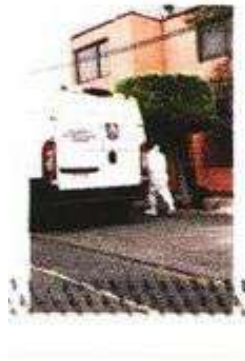
La Fiscalía indaga si la joven murió de forma accidental o si fue un feminicidio.