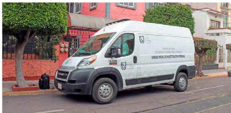
CARPETA. La Fiscalía capitalina inició una investigación bajo el protocolo de feminicidio, por lo ocurrido en la alcaldía Gustavo A. Madero.

En atención al caso, la Fiscalía General de Justicia local abrió una carpeta de investigación bajo el protocolo de feminicidio. /24HORAS