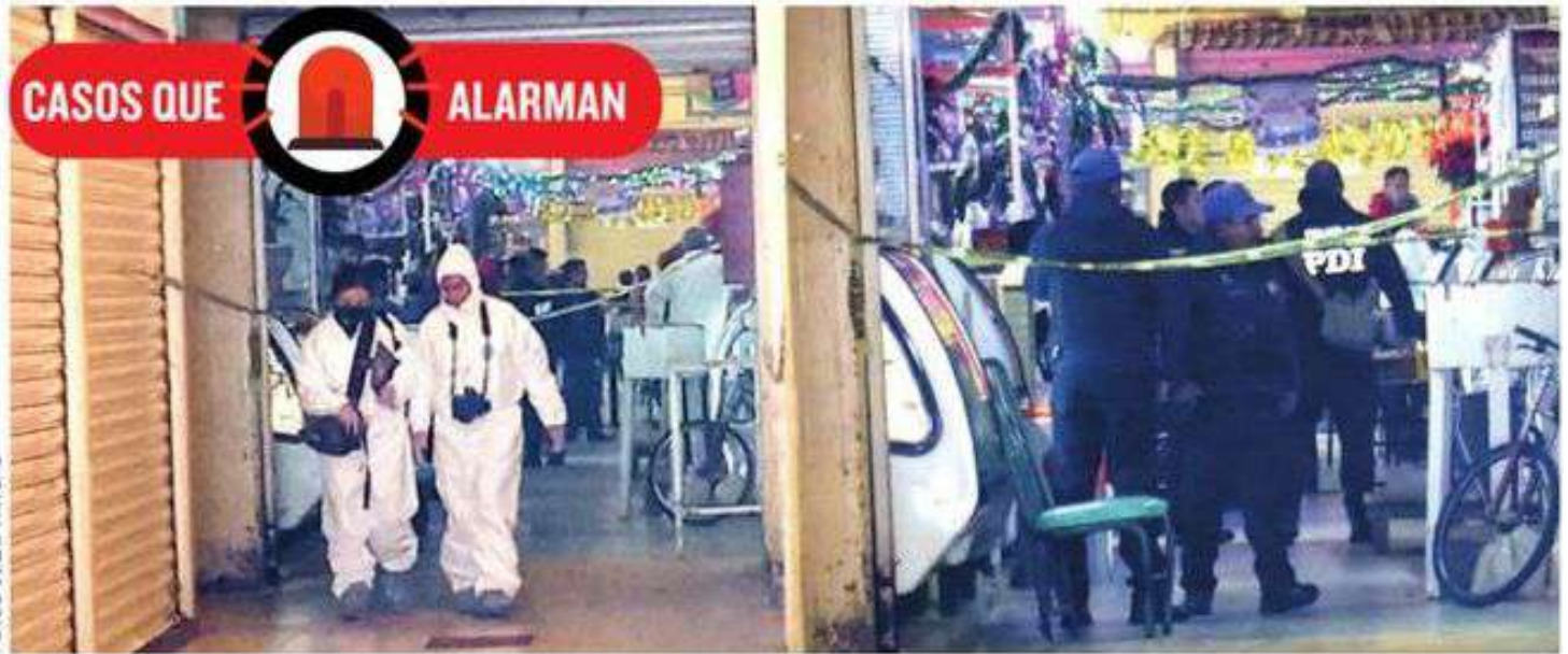
Los mercados de distintas alcaldías son una mina de oro para los delincuentes