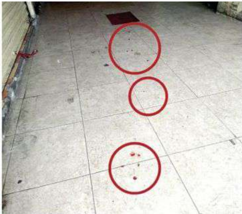
El delincuente iba herido y dejó manchas de sangre