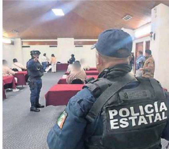
Sólo las personas que no han sido sentenciadas podrán ejercer su derecho al voto en las próximas elecciones.