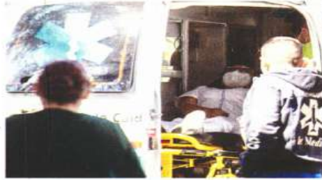
RENOVO EL UNIVERSAL

Tal como sucedió con el sector salud, autoridades pondrán a disposición ambulancias para atender reacciones de la vacuna.