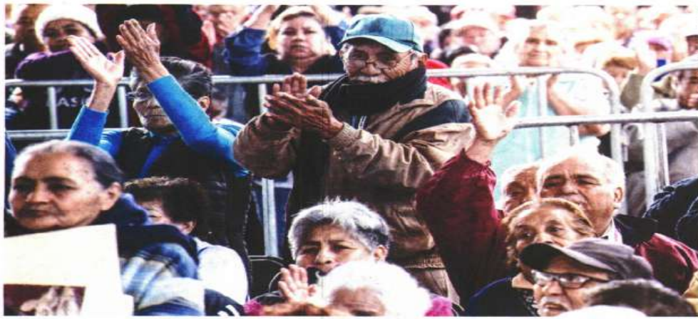
RENOVO EL UNIVERSAL

En el Estado de México habrá 102 mil 760 dosis que se aplicarán a partir del 15 de febrero, en una primera etapa, en 24 municipios, informó la Secretaría de Salud estatal.