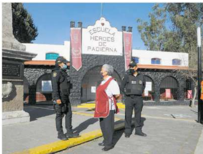
Gráfico: Luis Calderón

Esta primaria , en Magdalena Contreras, es una de las 70 unidades de aplicación