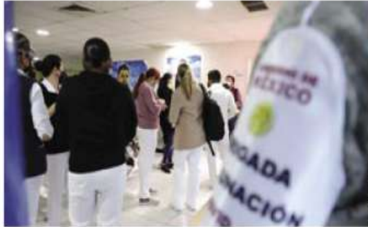
Comienza el proceso de vacunación.

apellido paterno comience con la letra A a la G.