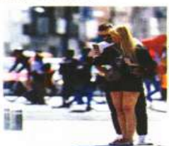
Algunas parejas sólo basearon por la Ciudad el 14 de febrero.