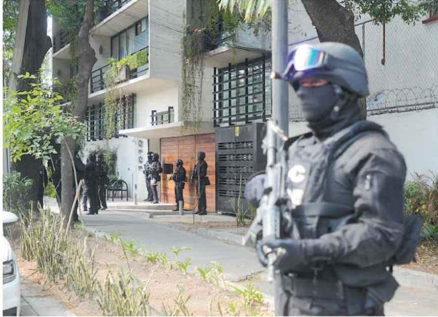
El 9 de febrero ocurrió el aseguramiento más reciente, de 60 kilos de cocaína, en un departamento en la colonia Narvarte / LUIS BARRERA