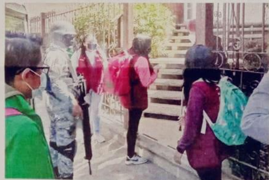
En Cuajimalpa brigadistas invitan casa por casa a la campaña de vacunación custodiados por la Guardia Nacional.

La Jefa de Gobierno, Claudia Sheinbaum, agregó que no va a ser la Policía, sino servidores públicos quienes orienten al exterior de los lugares de vacunación a quienes se acerquen a pedir informes o canalizar a otros centros de vacunación.