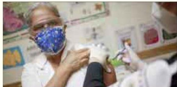
Se vacunará a 79 mil adultos mayores en 5 días en la Ciudad de México, en 70 centros de vacunación.

El tiempo de espera para ser vacunados con la vacuna AstraZeneca, será de alrededor de dos horas, y después de que ya le hayan aplicado la vacuna a la persona, se le tendrá en observación durante 30 minutos para verificar que no tenga ninguna reacción.