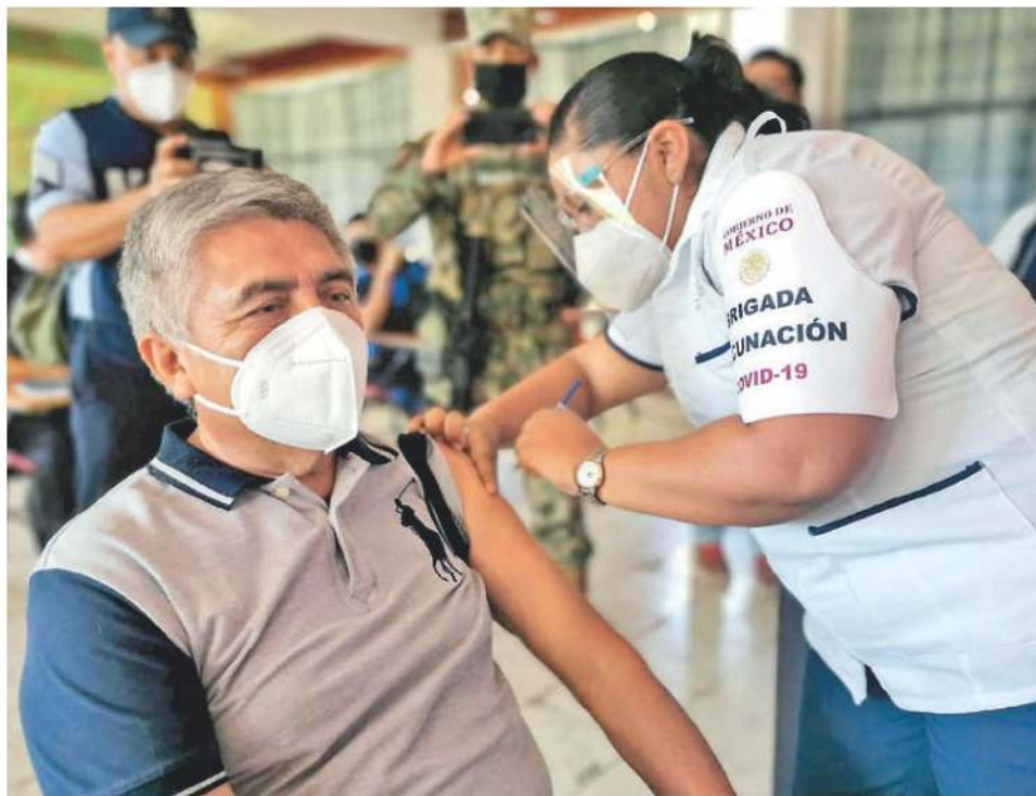
Los adultos mayores deberán acudir con su identificación oficial que señale la edad, residencia en la alcaldía en que se va a vacunar y su cartilla de vacunación.