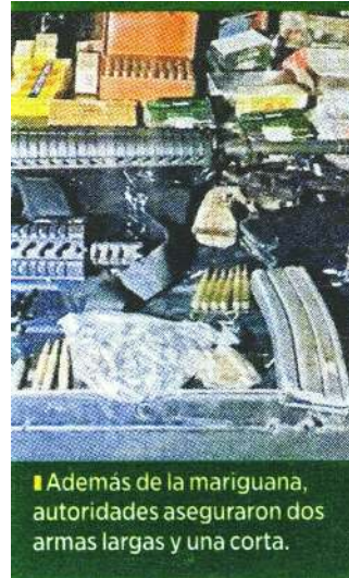
■ Además de la marihuana, autoridades aseguraron dos armas largas y una corta.

Derivado de lo anterior, se aseguraron alrededor de 20 kilogramos de hierba verde y seca con las características de la marihuana embalada en bolsas de diferentes tamaños y paquetes en forma de ladrillo confeccionados en cinta canela, así como 10 bolsitas que contenían un polvo blanco similar a la cocaína.