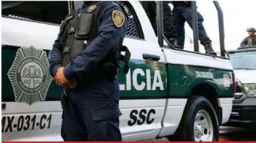
Los policías reforzarán la vigilancia en las inmediaciones de los centros de vacunación.