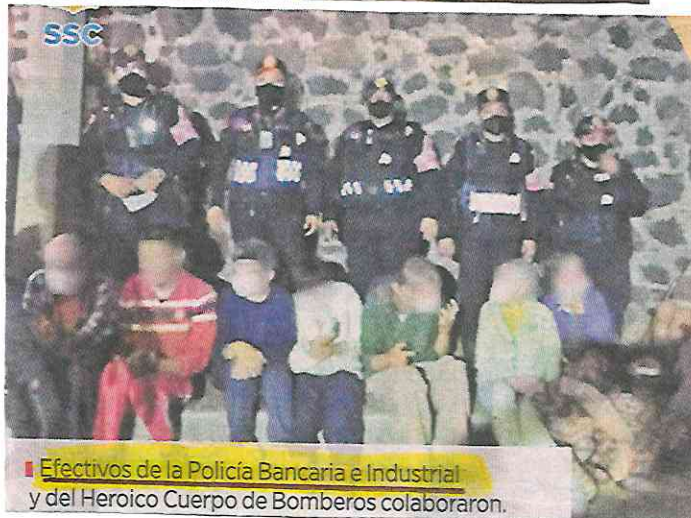
■ Efectivos de la Policía Bancaria e Industrial y del Heroico Cuerpo de Bomberos colaboraron.