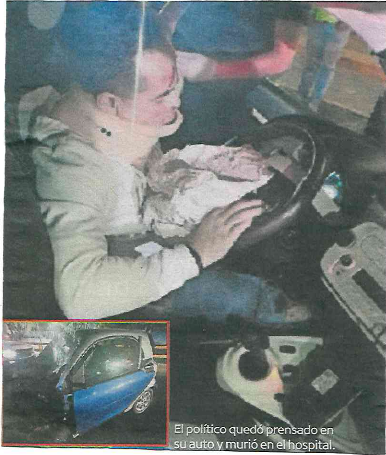
El político quedó prensado en su auto y murió en el hospital.

El 7 de marzo, la coalición PAN-PRI-PRD determinó que Luna Estrada sería su candidato para Álvaro Obregón, pero tres días después optaron por que él iría por la diputación federal para el Distrito XVIII.