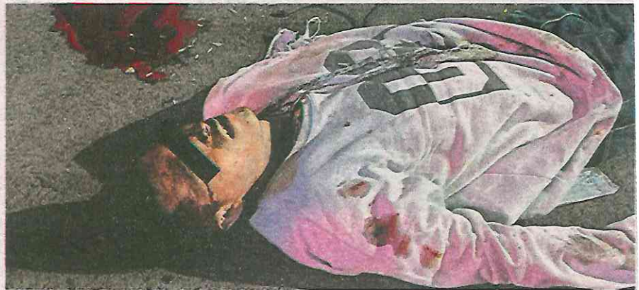
Así quedó luego del pleito que terminó a balazos

Testigos de los hechos y de las detonaciones, llamaron al número de emergen-