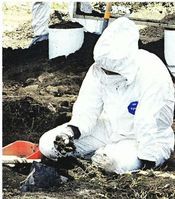
Hasta el último corte, en el lugar se habían hallado más de 500 restos óseos. Posiblemente, de tres personas.

“Más de 450 restos (más los 149 de ayer), desde que yo empecé mis jornadas de búsqueda, en 2020, es lo más grande que he visto”.