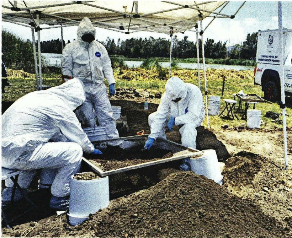
PALMO A PALMO. Un grupo de ocho forenses de la FGJ revisan el predio, en los límites de la Alcaldía Tláhuac y Valle de Chalco, Edomex.