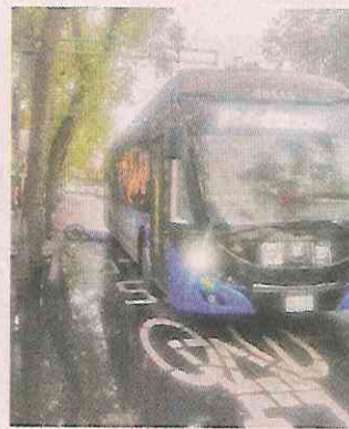
■ Un ciclista falleció bajo las llantas de un Trolebús.

El conductor de la unidad fue puesto a disposición de la Fiscalía General de Justicia de la Ciudad de México, informaron las autoridades.