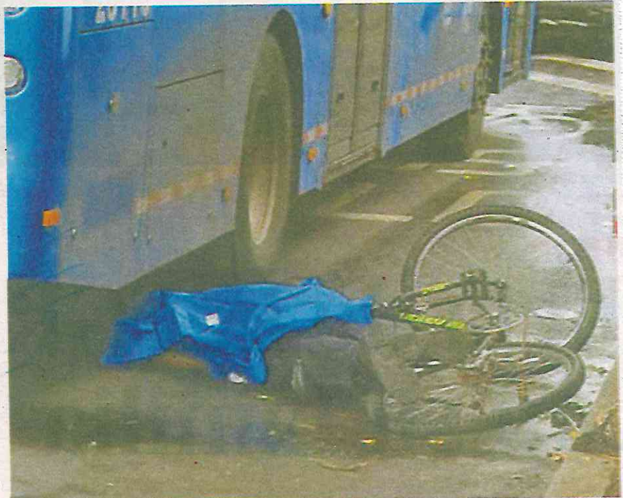
El cuerpo de la víctima hasta el momento continúa en calidad de desconocido /FOTO: JAIME LLERA.

Socorristas arribaron al sitio para auxiliar a la víctima, pero nada pudieron hacer por el hombre, pues la llanta trasera